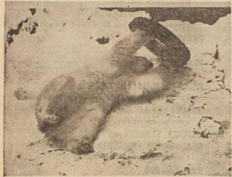
Sneg je zapadel tudi v Angliji in priljubljeni severni medvedek »Queenie« iz edinburškega živalskega vrta se ga je še zlasti razveselil. Ves iz sebe od radosti se valja po snegu in igra s starim avtomobilskim plaščem