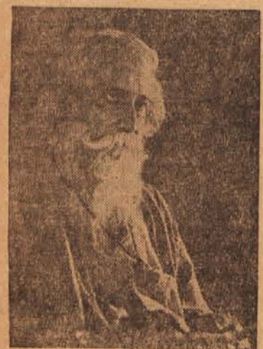
Rabindranat Tagore (K članku o indijski književnosti)