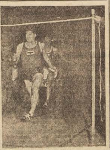
Ob 50-letnici obstoja atletske organizacije v Berlinu je bil v Sportni palači velik telovadni in športni nastop. Med drugimi je tekmoval tudi Heinz Fütterer, ki ga vidimo pred zmago na 50 m

Spričo tega se udeležujejo v dobro opremljenih in urejenih telovadnicah 103 oddelki s 3735 dijakinjami in dijaki (57% vse srednješolske mladine), v zaslihih telovadnih prostorih vadi 14 oddelkov s 455 srednješolci (6%), v telovadnicah sosednih šol pa gostuje 73 oddelkov s 2425 dijakinjami in dijaki (37% vseh obiskovalcev srednjih šol).