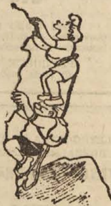
»O, Franci, zdaj pa vidim zelo dobro.«