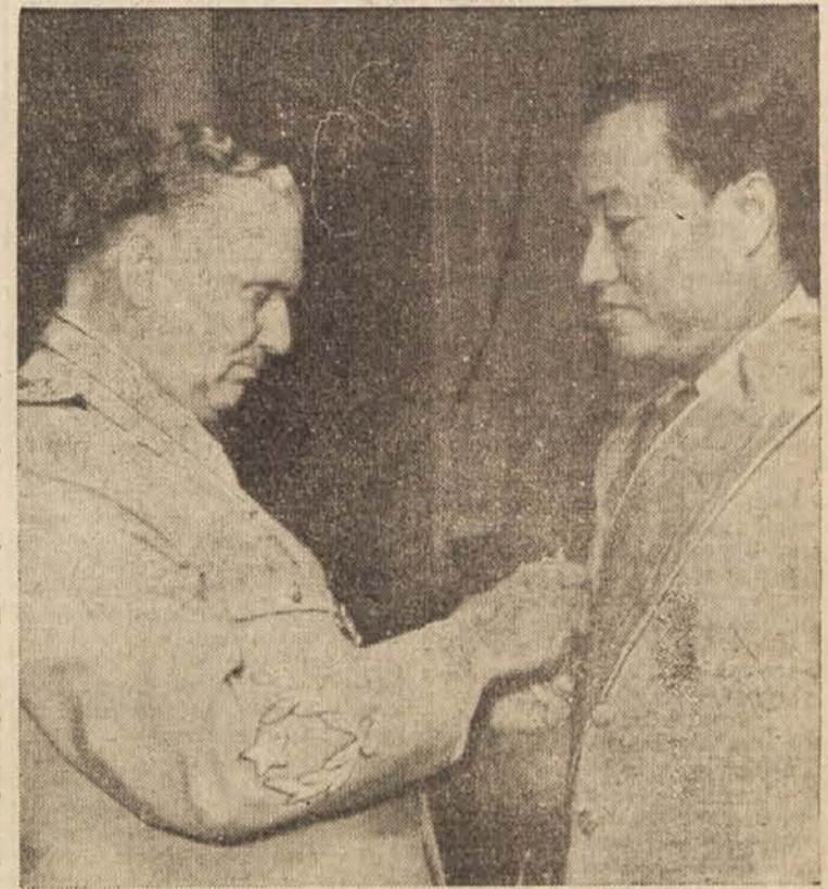
Predsednik Tito je obiskal poveljnika burmanske vojske generala Ne Vina

pojmovanja vloge in značaja Balkanske zveze vodijo do zaključka, da je bilo zelo pravilno, da se je Jugoslavija začela tesneje povezovati z vodilnima azijskima miroljubnima državama, ki sta popolnoma proti vsaki agresiji, za mir in koeksistenco. Končno, je zaključil predsednik Tito, je najbolj žalostno, da so se v omenjenem poskusu vmešavanja v naše notranje zadeve znašli na isti liniji skupaj z najbolj reakcionarnimi elementi v svetu tudi nekateri socialistični elementi na Zahodu. Naše potovanje v Indijo in Burmo je dejansko velikega pomena in nadvse koristno. Naravnost velikanskega pomena je za nas povezovanje z drugimi državami, izvajanje dosledne politike na mednarodnem področju, pridobivanje somišljenikov v borbi za mir in koeksistenco. Jugoslovanska zunanja politika ne bo mogla v bodoče ostati samo pri sedanjih etapi, temveč se bo morala še globlje in bolje povezovati z mnogimi drugimi državami.