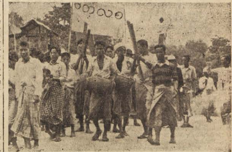
Burmanski kmetje manifestirajo ob agrarni reformi