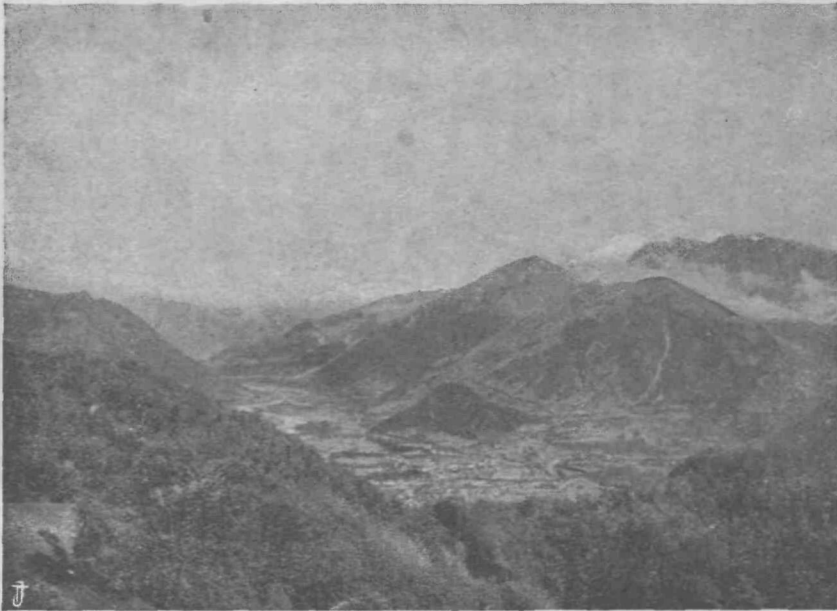
Tolmin, v ozadju Mrzli vrh in Krn.

Odkorakali smo dalje po vroči cesti, želeč si kmalu zopet nazaj v Gregorčičev „planinski raj“.