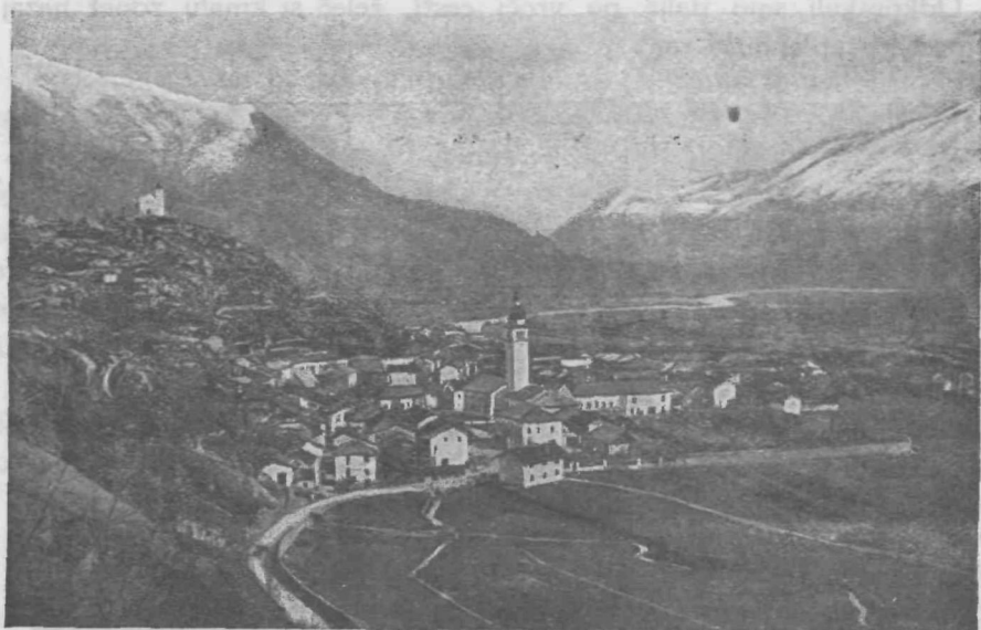
Kobarid, kraj „italijanske zmage pri Caporetu“.

mejne naše kraje gorje in razdejanje. Zaplakalo je zbegano ljudstvo v brezmejni togi in boli in prestrašeno bežalo s svojih ogroženih domov na vse strani, največ v begunska taborišča na Štajersko, a svojo grudo in svoj dom prepustilo vojnim vihram, ki so pričele neusmiljeno besneti po teh krajih. Grabežljivi sovražnik je že takoj prve dni prestopil meje in brez boja zasedel Breginj, Kobarid, Livek, Kolovrat, Srednje in skoro vsa Brda. Dalje pa ni mogel, ker je zadel na naš odpor. Na višini pri Sv. Mariji pred izpraznjeno vasjo Volčje se je utrdil naš bataljon, in na desno je šla bojna črta preko mostu čez Sočo za Tolminom na Mrzli vrh in dalje na Krn. Sovražnik nas je najprvo obstreljeval z Ježe in s Kolovrata, potem pa je pričel besno naskakovati naše vrste. In gledali smo strašno razdejanje tega planinskega raja, ki se je izpreminjal v grozo in pekel. Kako nam je bilo bridko, ko smo morali siliti iz Volč zadnje prebivalce, ki so bili že v smrtni