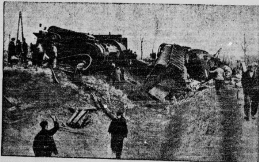
Na brzni vlak blizu Linca je bil izvršen atentat. Dve osebi sta bili ubiti, 16 hude ranjenih.

Ako kralj kliče narod v pravično vojno, potem je njegovemu klicu treba slediti. Prav tako je kristjan dolžan, da spolnuje svojo dolžnost, če gre za plačevanje pravično odmerjenih davkov. Kdor okrađe državo, okrađe svoje sodržavljanke. Nadalje je senator opozarjal na prisego katoliških učiteljev. Katoliški učitelj, ki poučuje v verski šoli, priseže zvestobo kralju in ustavi in sicer z dostavkom: »Kakor mi je Bog priča«. Prisega kralju in ustavi je jamstvo, da bo takšen učitelj zvest tudi vsem državnim zakonom.