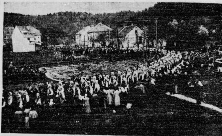
Proslava sv. Janeza Boska na Rakovniku: Del ogromne procesije z narodnimi nošami.