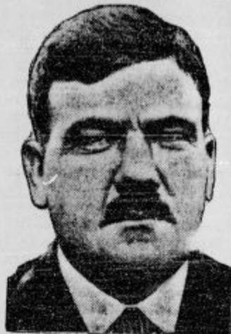
Nekdanji predsednik Meške Cates, znan posebno po svojem preganjanju katoličanov, je nevarno zbolel. Splošno domnevajo, da ne bo prestal bolezni

Poleg tega zavežejo kandidatu oči, nosijo prižgane sveče, žvenketajo z meči, zažigajo strelni prah, stavijo različna vprašanja in uganjajo še druge »scopnije«. In ta cirkuska pajacada je nekim današnjim modernim ljudem večje vrednosti, kot resni, vzvišeni nauk katoliške vere in Cerkve!