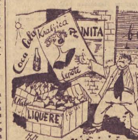
»Če že posnemamo kapitaliste vsepovsod, potem tudi glede propagandnih prijemov ne smemo zaostajati za njimi.«

Polletni plan v eksploataciji gozdov je bil v območju direktorije LIP-a dosežen v sečnji za 115%, spravilu 109%, oddaji za 117%, v oddaji za eksport pa za 127%. V žagarski industriji pa je bil plan dosežen v rezanem lesu za 108%, pri zabojih 103%, plan oddaje za izvoz za 108% itd.