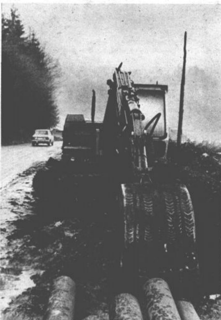
Delavci in stroji Nivoja iz Celja so pričeli urejati nov industrijski vodovod iz Topolšice do termoelektrarne Šoštanj.