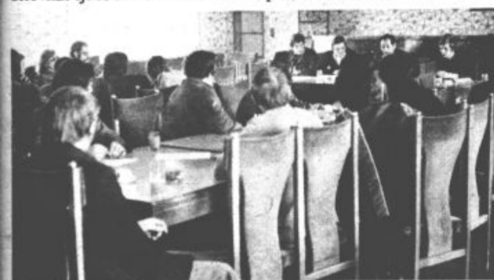
Komisija za splošni ljudski odpor pri tovarniški konferenci zveze socialistične mladine Slovenije Gorenje je pripravila razgovor o zakonu o ljudski obrambi. Razgovora so se udeležili mladinci, ki sodelujejo v komisijah za splošni ljudski odpor v temeljnih organizacijah združenega dela Gorenje kot tudi v krajevnih skupnostih. Mladi so pokazali veliko zanimanje za zakon in obnem spregovorili o vlogi mladine v konceptu splošnega ljudskega odpora. H. J.

Letošnje jubilejno leto, ki se torej že odraža v vse širše zasnovani družbenopolitični tvornosti, je v občini Velenje tudi v znamenju prizadevanj za poglobljanja samoupravljanja in samoupravnih odnosov, uveljavljanja vsebine zakona o združenem delu in novih dohodkovnih odnosov ter borbe za večjo produktivnost, boljše delo in gospodarjenje ter za nagrajevanje po rezultatih dela.