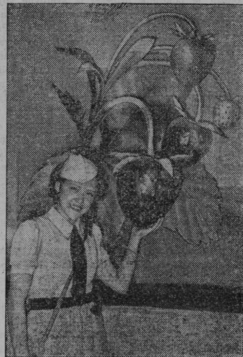
Na nemški vrtnarski razstavi je bilo videti ponarejene orjaške jagode.

Poslevoedeči podpredsednik. Svoj čas smo mnogo čitali o poslevoedečem podpredsedniku JNS, se-