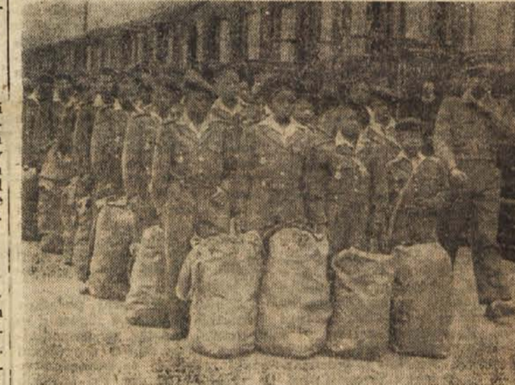
Otroci afriških domačinov, ki jih bodo »vzgojili« v Franciji za vojsko, ki bo razmeščena v francoski Vzhodni Afriki

Zunanji ministri ZDA, Velike Britanije in Francije so se sestali nocoj v prostorih ameriške delegacije v San Franciscu. Dulles, Macmillan in Pinay so izmenjali misli pred sestankom, ki so ga imeli potem s sovjetskimi zunanjim ministrom Molotovom.