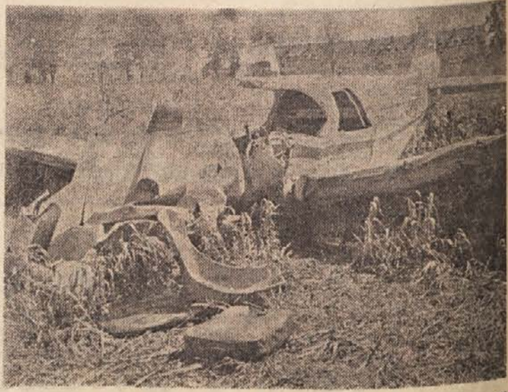
V bližini letališča Riem pri Münchenu se je smrtno ponesrečil neki švicarski športni letalec, ko je moral zasilon pristati zaradi okvare motorja. Na sliki vidite razbito letalo. V ospredju sta sedalci, ki ju je udarec iztrgal iz letala

Glasovi, hrup, odlomki iz pomenkov: pravijo, da se je Mei Lan Fang postaral. Newyorška borza se maje. Kdorkoli že bo dobil to vojno, nekaj drži — mi, belci, bomo prikrajšani. — Rajši Japonce kakor komuniste. — To je konec eksteritorialnosti. —