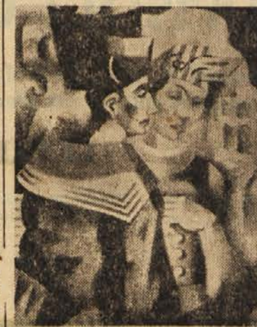
Lhote André (Ecole de Paris); Mornar, 1930, barvna litografija