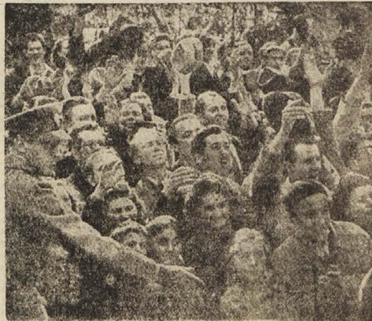
Na današnji dan pred 13 leti so narodi Jugoslavije pod vodstvom Komunistične partije izrazili z množičnimi demonstracijami svojo pripravljenost, braniti svobodo in neodvisnost. Zvoljo tega je 27. marec — dan vseljudskega gneva proti takratnim oblastnikom, ki so hoteli izročiti državo na milost in nemilost hitlerjevskim osvabalcem, prišel kot svetla in ena najpomembnejših strani v našo zgodovino. Neizbrisni so spomini na ta dan, ko so delavci, kmetje, vojniki in dijaki složno vzklikali: »Rajši vojno kakor pakt, »Rajši grob, kakor postati suženj!« Na sliki: Ljudstvo ogorčeno demonstrira na beograjskih ulicah — 27. marca 1941

kliničnih bolnic, na njihove neustrezne notranje naprave (vodovodne, kuhinjske, pralniške itd.). O ljubljanski polikliniki je podčrtala, da je v gradnji že sedmo leto in da bi močno razbremenila klinične bolnice. Njena dograditev bo terjala 466 milijonov, prispevali pa bodo za to tudi Ljubljana, ljubljanski okoliški okraj in Zavod za socialno zavarovanje. Posebno težaven je položaj na področju bolnic za duševne bolezni, v katerih je v primeri z realnimi potrebami šestkrat premalo postelj in so poleg vsega nesodobno urejene. Paviljon za TBC v Valdaltri bo prevzel naloge sedanje bolnice za kostno TBC v Sempetru pri Gorici, kjer se bo tako lahko začel razvijati prepotrebni zdravstveni center gorškega okraja in Primorske. Kar pa zadeva Topolšico, bi moral Izvršni svet ponovno proučiti problem njene dograditve, ki je prav tako običajla. Rehabilitacija invalidov ima še svoj poseben pomen spriču moralne in gospodarske nujnosti, da se invalidi (Nadaljevanje na 2. strani)