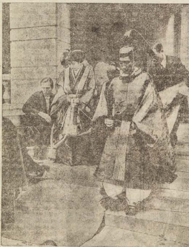
Japonski ženitovanjski obredi

socialnemu zlu. V boj je poslala 125.000 komisarjev. Policija in sodišča so imela lani opraviti s 67.000 primeri takšne sramotne trgovine. Samo v 98 primerih pa so sodišča izrekla obsodbe. Kakih 80% ljudi, ki prodajajo in kupujejo otroke, se namreč ukvarja s to trgovino iz