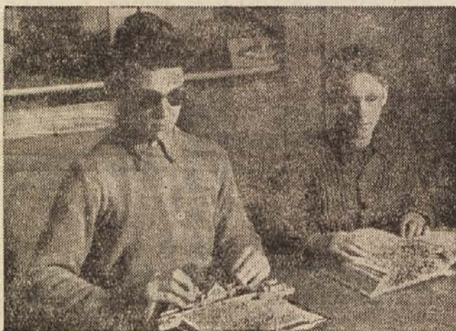
V zavodu za slepo mladino se mladi ljudje nauče pisati in brati in prav tako ko ostala mladina obiskujejo gimnazijo in se usposabljaajo za marsikatero poklic

Med potjo do bolnišnice smo se ustavili tudi v Cerknem in obiskali