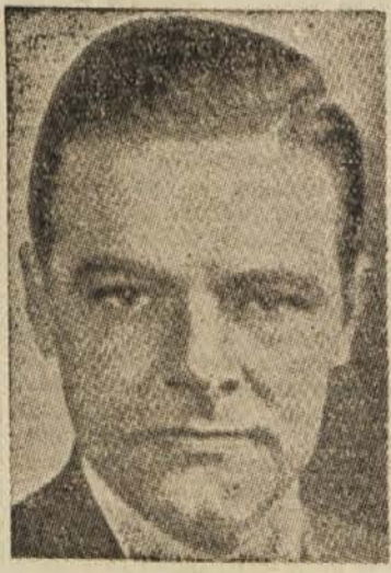
Henry Cabot Lodge

New York (USIS). Nečelnik ameriške delegacije pri OZN Cabot Lodge je izjavil, da lo bližnja ženevska konferenca zahodnim veleposlanom omogočila, da preverijo politiko in namere Sovjetske zveze in Kitajske v Aziji. Pripomnil je, da bodo SZ, Kitajska in Severna Koreja sodelovale na tej konferenci »kot države, odgovorne za vojno na Koreji«.