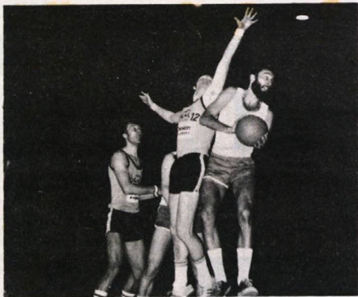
Košarkarji BETI na eni izmed tekem.