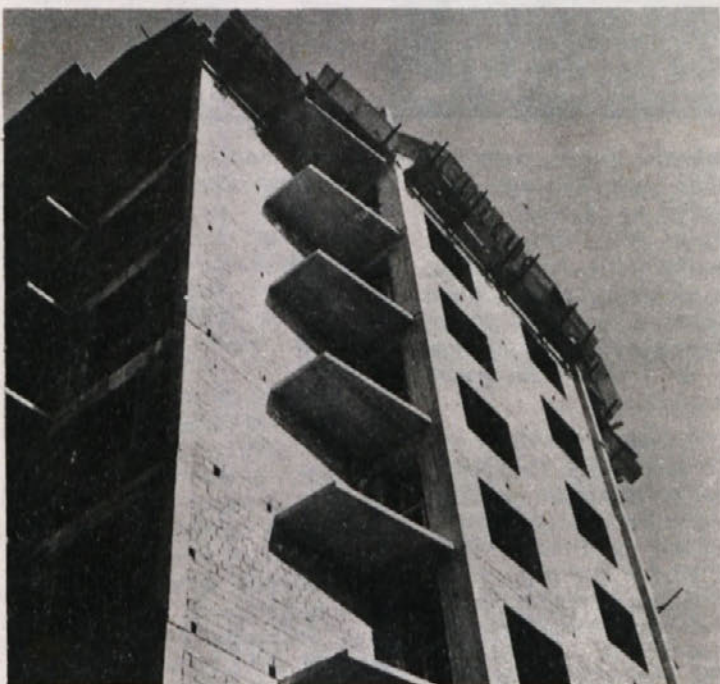
Stanovanj ni nikdar dovolj. Veliko je ljudi, ki leta in leta čakajo, da pridejo do strehe nad glavo. V novem naselju pri BETI gradi TGP visok stolpič, ki se ga že prijemlje ime „metliški nebotičnik“.

Ob zaključku srečanja v sejni sobi so se dogovorili, da bi bilo podobno srečanje čez približno dva meseca in da bi razgovori postali navada, ki bi se lahko sprevrgla v debatni klub, saj problemov in težav ter svežih misli nikoli ne manjka.