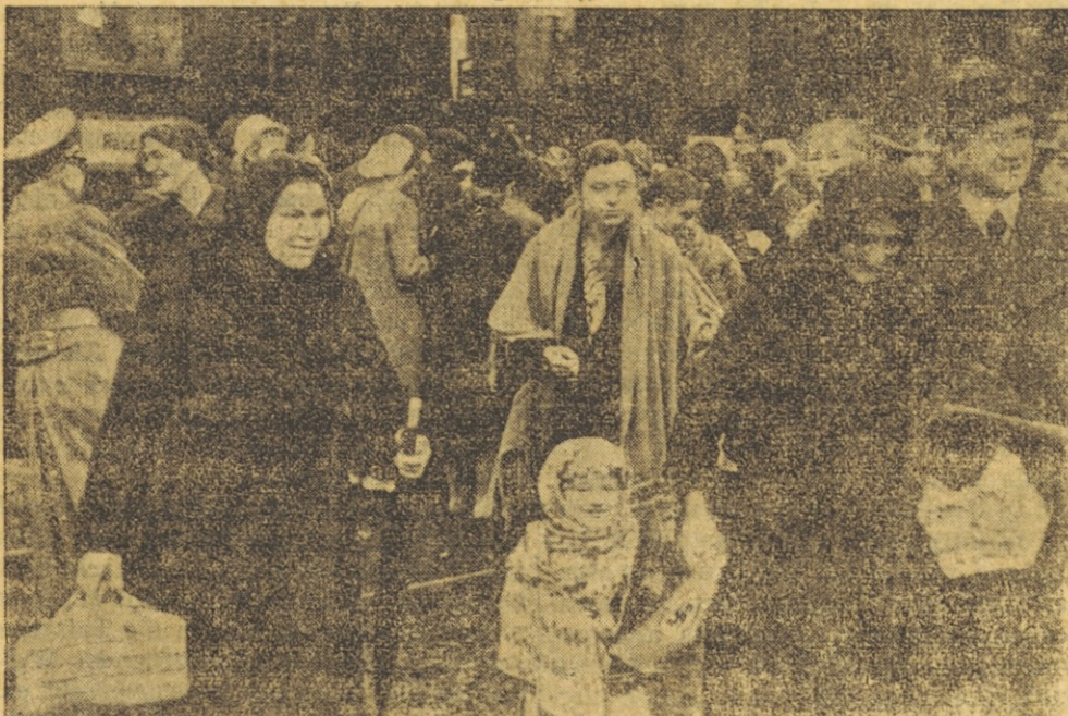
Im Zuge der großen Umsiedlungsaktion in Südosteuropa trafen soeben die ersten Deutschen aus Bessarabien in der großdeutschen Heimat ein. Die Organisation der Partei, insbesondere die NSV., nahmen sich sofort der Rückwanderer an, um sie in jeder Weise zu betreuen. — Unser Bild zeigt die Ankunft des ersten Rückwandererzuges in Böhmisches-Leipa.