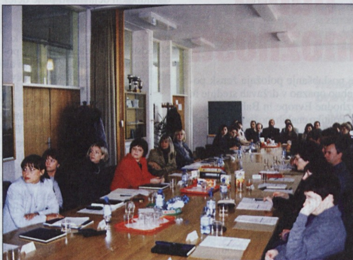
Na okrogli mizi so se poleg strokovnjakov z univerze zbrali tudi predstavniki 14 tekstilnih podjetij (metražerjev) iz vse Slovenije.