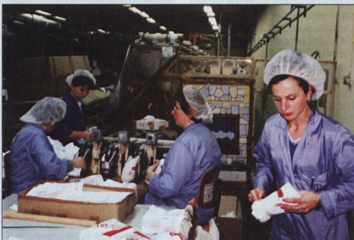
Delavke Tosame so med ogledom tovarne pridno pakirale higienske izdelke.