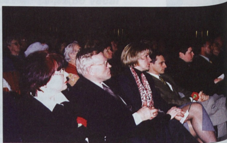
Na proslavi se je zbralo več kot 400 udeleženk in udeležencev.