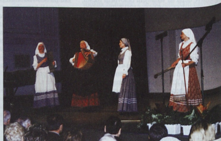
S starimi pesmimi in običaji je navdušila etno skupina Spominčice.