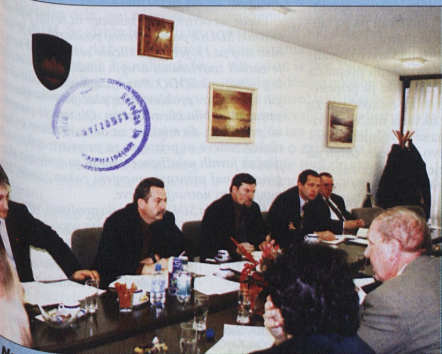
Na sestanku so sodelovali predstavniki vlade, gospodarske zbornice, združenja delodajalcev in SDE