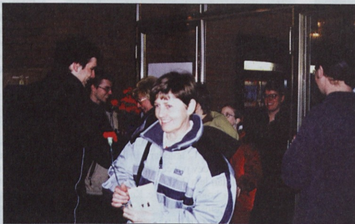
Vsem udeleženkam so organizatorji proslave podarili nagelj.