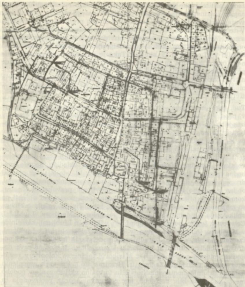
Katastrsko niveletni načrt Celja, V. pl. Thomka, 1913

spoštovanih »svobodnih poklicev« tako kot odvetniki, zdravniki. Na tem mestu pa bi radi spregovorili o nečem drugem, o pojmu arhitekturnega tipa.