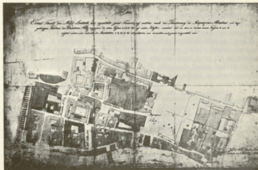
Načrt regulacije območja nekdanjega kapucinskega samostana v Ljubljani, 1820