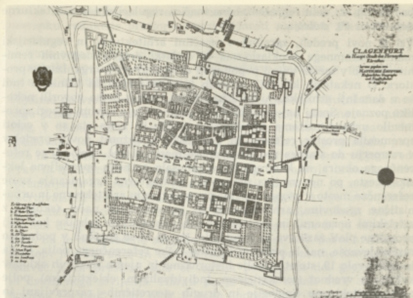
Plan Celovca, glavnega mesta Koroške, 1741