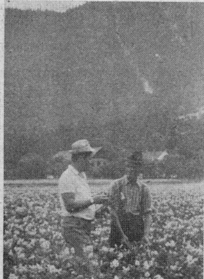
Pridelovanje semenskega krompirja je donosno