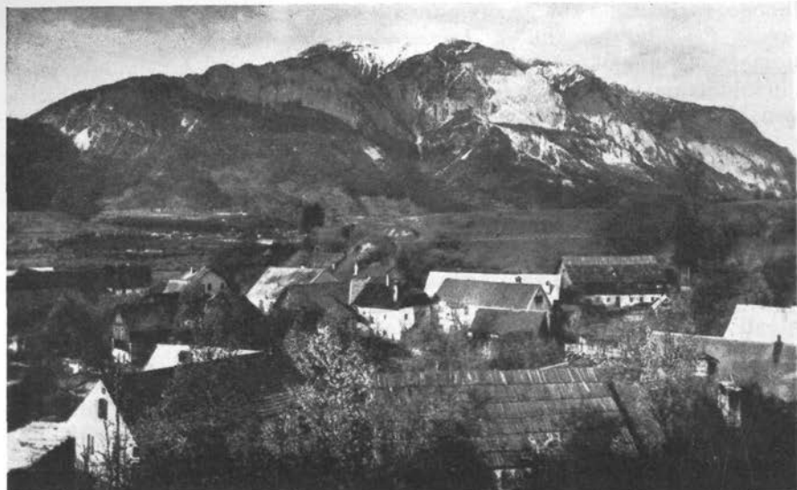
Bistrica na Zilji, z Dobračem

Marija na Zilji je število Slovencev padlo na 43%, v občini Bekštajn na 54% (prvič z nemško večino v nekaterih vaseh ob progih na Podklošter in na Področčico); ponemčile so se vasi Zabače in Rogije pod Dobračem, ki so imele leta 1890. še slovensko večino; v občini Podklošter so dobile nemško večino vasi Lipa, Peč in Rekarja vas (vse ob železnici ali glavni cesti). V dolini nad Podkloštrom so v občini Smerče leta 1910. uradno našteali le še 49% Slovencev, k čemer sta pripomogli zlasti v turističnem in prometnem pogledu važni vasi Čajna in Čače, ležeči v jugovzhodnem vzhnožju Dobrača; medtem sta namreč dobili večino k Nemcem se prištevajočega prebivalstva. V ostalih občinah je ostala močna slovenska večina, ki je ponekod padla za 5 do 10%.