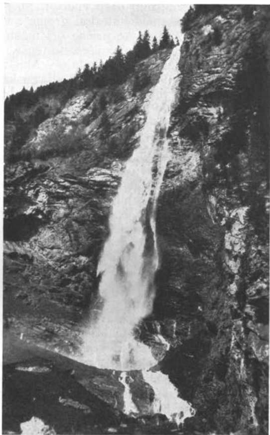
Fallbach (Malta, Koroško)

do 1801. imeli mesto zasedeno Francozi, 1808. pa je grof Hieronim Lodron ustanovil deželno brambo proti njim, nakar je leta 1813. mesto Gmünd in vsa Gornja Koroška bila zopet priključena Avstriji. Ko je leta 1886. požar uničil leta 1793. na novo zgrajeni grad, ga grofi niso več popravili; še danes ga vidimo v razvalinah. Leta 1932. je bil odpravljen fidejkomis Lodronov.