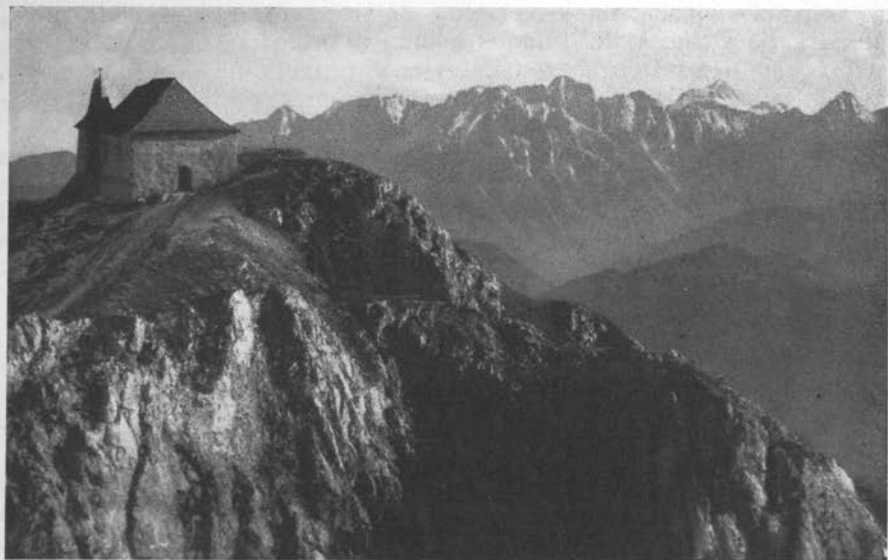
Vrh Dobrača, s Triglavom v ozadju

To zamočvirjenost so povzročili deloma veliki vršaji, nanosi stranskih grap, ki posegajo daleč v dolino in ovirajo odtok glavne reke; nadalje do neke mere zaježitve po podornem gradivu Dobrača in morda nekdanja jezera, ki jih je zaježil led v diluvialni dobi ali pa nanosi iz stranskih grap v kasnejšem času. Eno takih jezer se je ohranilo do danes, to je Preseško jezero pod Šmohorjem, ki kaže še sveže sledove svojega mnogo znatnejšega obsega. Vedno bolj pa se pripisuje zamočvirjenost Ziljske doline tudi sodobnim tektonskim premikanjem, zaradi katerih se njeno dno polagoma spušča in nagiblje pošev, vsi stranski potoki pa so prisiljeni poiskati si pot iz osrčja Karnijskih Alp do doline v tesnih iztočnih grapah ter brž nato odložiti velike vršaje: take grape in take vršaje je ustvarila Krnica pri Modrinji vasi, Blaški potok (»Graben«) pri Blačah in Bistrica pri enako imenovani ziljanski vasi.