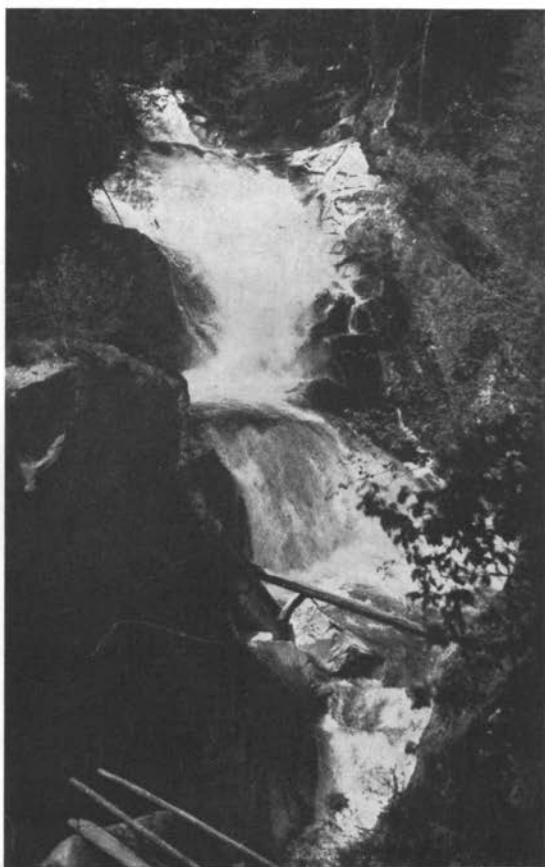
Tretji Gössfall (Malta, Koroško)

Iz Gmünda se peljemo z avtom — po skrajno slabi cesti — skozi vas Fischertratten, kjer vidimo proti jugu Dornbach, lovski grad grofov Lodronov. Dalje vodi cesta skozi Hilpersdorf v Malto (Maltein), ki je največji kraj te doline in hrani znamenite razvaline srednjeveškega gradu. Od tod se peljemo mimo gostilne Zirmhof do lepo ležečega in dobro obiskanega letovišča Pflüglhof (854 m).