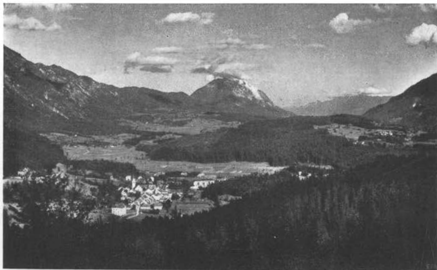
Šmohor v Ziljski dolini z Dobračem in s Karavankami