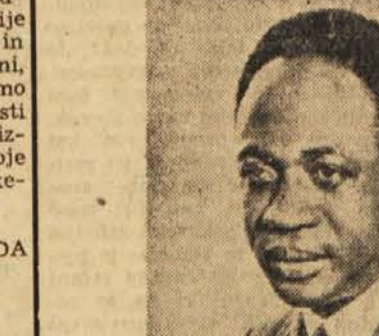
Kuame Nkrumah, ministrski predsednik Gane

Navesti hočemo še nekaj odlomkov iz njegove knjige »Gana«. Knjiga je izšla prav te dni in je pravzaprav politična avtobiografija Kuame Nkrumaha. V njej opisuje svojo zgodnjo mladost v neki vasici. »Moja družina je živela v miru. Prepripi so bili zelo redki. Zenske so kuhale in delale na polju, včasih pa so hodile v mesto na trg, da bi prinesle domov kaj denarja.«