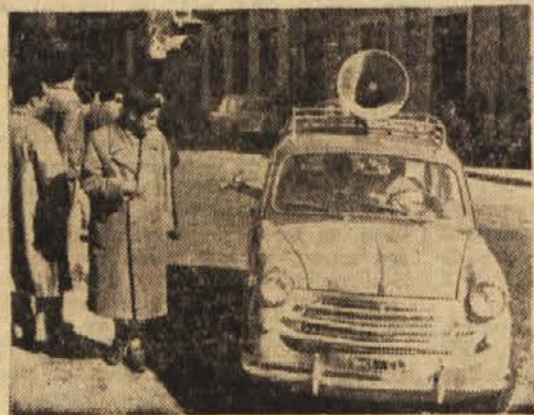
Kroštnjar v avtu, ki ponuja kemične svinčnike za mal denar.