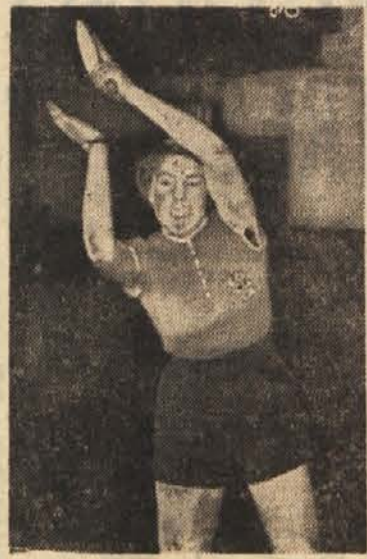
Tri druga mesta: Ann Haydon

KONČANO JE SVETOVNO NAMIZNOTENIŠKO PRVENSTVO