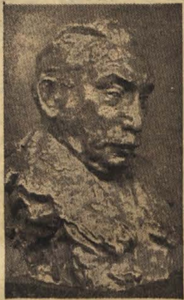
A. Augustinčić: Moša Pijada

Moša Pijada je bil nam mlajšim živ vir zgodovine ju-