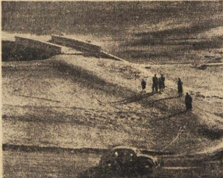
Afriška puščava? Ne, marveč izsušeno dno umetnega jezera za ederskim nasipom v Zahodni Nemčiji. Zaradi dolgotrajne suše so vode odtekale, potem pa so prišli kazat otrokom svojo rojstno pokrajino številni nekdanji kmetje, ki so se zaradi umetnega jezera preselili drugam. Kot kaže posnetek, se je v vodi še kar dobro ohranil nekdanji zidani most čez potok pod vasjo...

Potrebe po vodi naraščajo zlasti po drugi svetovni vojni tako