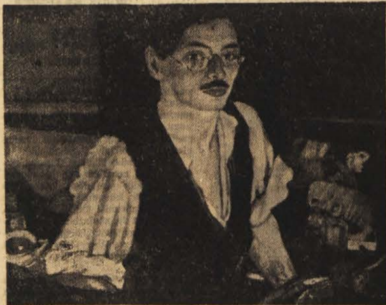
Moša Pijade: Avtoportret

Pomen Moše Pijade je prav v tem, da pomeni v našem sodobnem mrtoilu in močvirju realno gibanje, črto čez ves ta naš vozel malomeščanskih zapletenosti in idejnih komičnosti. To je poteza slikarja, ki prevzel s stvarnostjo zapre svoj talent, čopič in barve ter odputuje v Južno Makedonijo na narodno romantične pozicije. S teh pozicij se obrača v balkanski politični boj, med vojno depresijo pa še zmerom bril v njem lučka narodne romantike. Žalga naša osnovna kulturna laž in otem ko drugi trgujejo s patriotizmom, piše v Beogradu svojo študijo o Meštroviću z nacionalističnega stališča narodne pesmi. Po avstrijskem zlomu padejo o tem karnevalu dogajanja krinke. Moša Pijade preko herenijskega, proudhonskega gledišča o boju čedalje močnejše raste in tako po prelomu z imaginacijami čedalje globlje vstopa v stvarnost kot aktivist. To je pot ponosa in junaštva. In naj misli kdo o tem kakor hoče — vendar je to pot ponosa in junaštva.