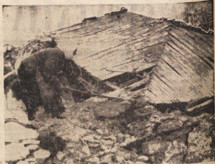
Po zadnjem potresu v Tesaliji. — Grška kmetica razkopava razdejano hišo