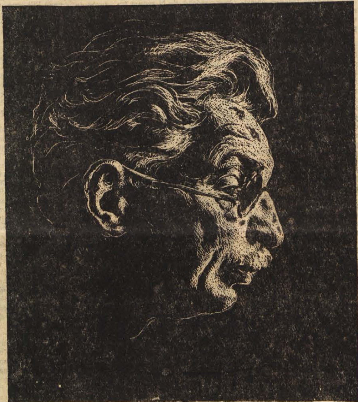
Božidar Jakac: Portret Moše Pijada