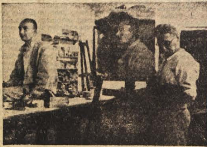
Moša Pijade pri slikanju

strasten slikar. Vzlic mnogim partijskim dolžnostim in poslom pred vojno, med njo in po osvoboditvi ni bilo trenutka, da ni mislil tudi na svoje slikarsko delo, na slikarstvo sploh. Brez njega nekako ni mogel živeti; če ni mogel slikati, je hotel vsaj vdihovati vonj oljnih barv, hotel se je vsaj dotikati tub z barvami in čutiti vsaj tisto malo radosti, ki jo čuti človek ob dotiku z nečim, kar ustvar slikarstvo.«