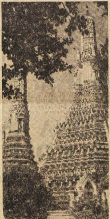
Budistično svetišče v Bangkoku

Tajska je ena izmed treh azijskih dežel, ki so članice SEATO, Zahodne zveze za jugovzhodno Azijo, ki ima tudi svoje središče v Bangkoku. To je hkrati ena redkih azijskih dežel, ki ni navezala diplomatskih stikov s Kitajsko. Zunanja politika se sploh dokaj pogosto razhaja z bandunško politiko ostalih azijskih dežel.