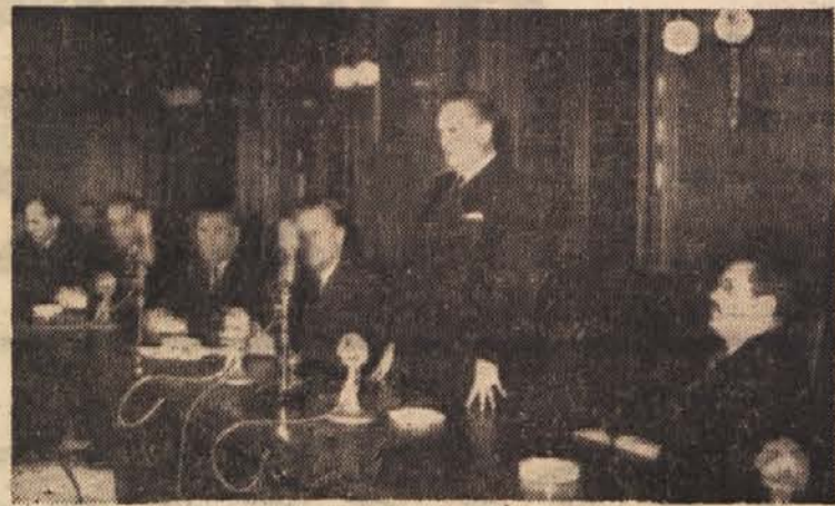
Z žalne seje Zveznega izvršnega sveta

Tovarišu Pijadu bodo izkazali na pogrebu največje časti. V pogrebem sprevedu bodo sodelovale razen Beograđanov, ki je z