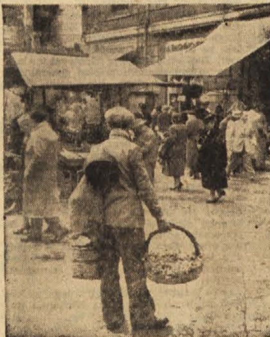
Kalabrijski ribič s svojo lovjo na trgu v Reggio. (leva slika)

Prav zavoljo vsega tega se mi zdi, da bo sedanja vladna agrarna politika, ki ji dajejo ston demokratizirana veleposesniška desnica in liberalci (ki bi jim že dlje časa mnogo bolj ustrezal naziv — konservativci), kolikor se bo v tej smeri nadaljevala, slej ko prej pripeljala do takih, nemara pa še množičnejših izbruhov, kakršni so se vrstili od leta 1947 do 1950.