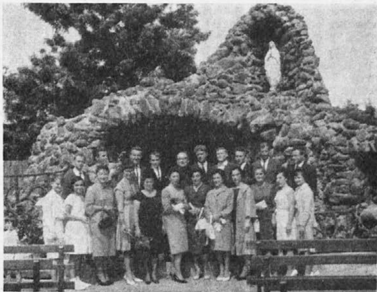
Pevski zbor pred "Lurdome", Kew, Vic.

Večni mir rajnemu nadškofu! Ozdravljenje novemu, če je taka božja volja!