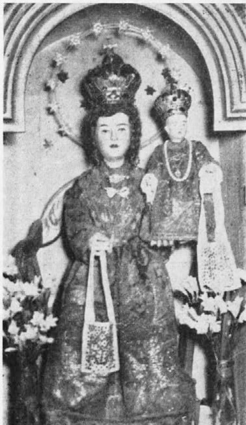
POGRAJE: Marijin oltar

"Spet kliče nas venčani maj k Mariji v nadzemeljski raj. Da večno veseli Mariji bi peli, o Jezus, to milost nam daj!"