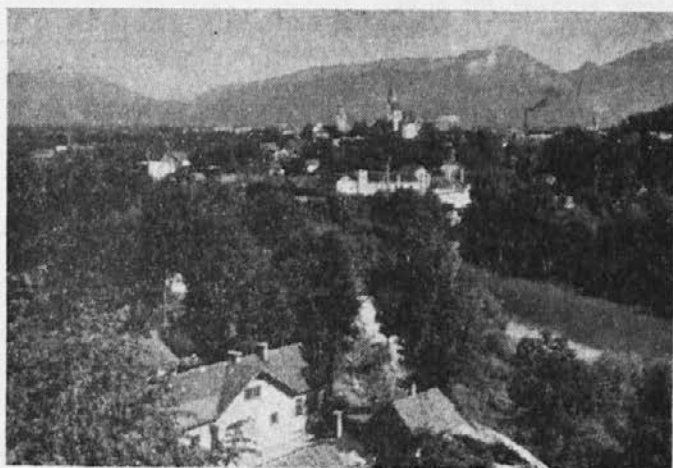
KRANJ — gorenjska prestolica

Koko bo vse to uplival na zabetonirane pvače, navem. Za kolk bo treba spet pas zategnt, tud navem, če morš pa dat dons za eno dobro kilco mesa že kar dčsetino pvače. Naša agencija E.B.P. (ene babe pravjo), scer prav, da se je treba u teh cajteh najdet, pa so toko prefrigane, da nekatere še cvo "Pelemontelne" kupujejo na potrošniški kredit.