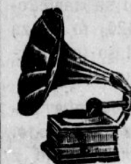
Ceniki poštnine prosti.

BIATJEL-U Gorica, STOLNA ULICA 3-4. Mehanična delavnica. Prodaja tudi na obroke