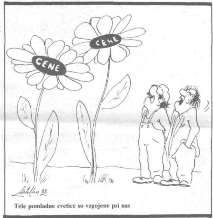
Tele pomladne cvetice so vzgojene pri nas