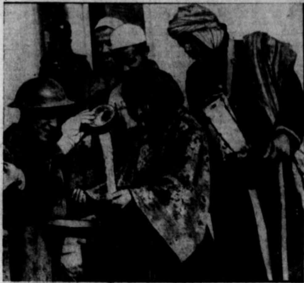
SLIKE, KI SE BODO SE PONOVILE! Silna beda, ki jo je povzročila minula svetovna vojna, ni še niti zdalec pozabljena, a že se pripravljamo na novo. V Egiptu, v ostalih delih Afrike, v Aziji — povsod smo morali po zrusevanju mest in zgradb pomagati tistim, kolikor jih je ostalo. To stane. Slika izgleda človekoljubna, toda ni. Čemu se ne bi dežele raje zavele graditi kar jim je bilo porušena namesto da se pripravljajo v nova, še večja pokolja?