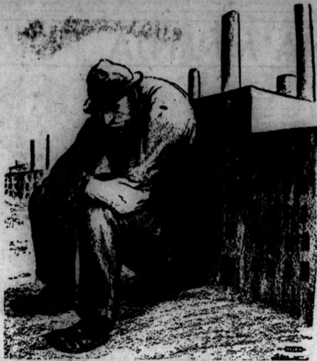
OKROG ŠTIRI MILLJONE delavcev je spet brezposelnih. In kaj, ako se bo to nadaljevalo?