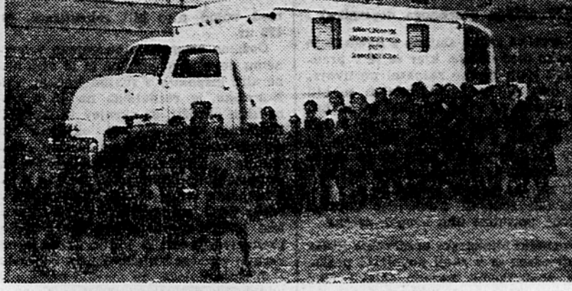
Avtomobil za množično rentgensko slikanje pljuč, ki ga je v Slovenijo poslal Mednarodni dečji fond — UNICEF. To je dragocena pomoč k prizadevanju naših zdravstvenih oblasti za varstvo zdravja naših otrok in mladine.