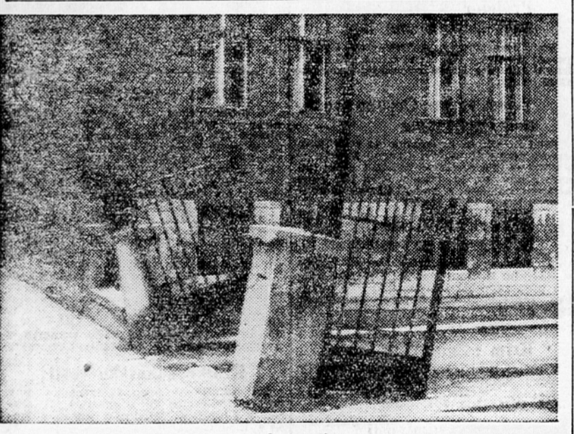
»Dramatičen prizor od ljubljanskih Drami

SE ČESTARJEV za vzdrževanje cest na teritoriju mesta Ljubljane sprejme poverljivost za več letno delo. Podrobnosti javimo.