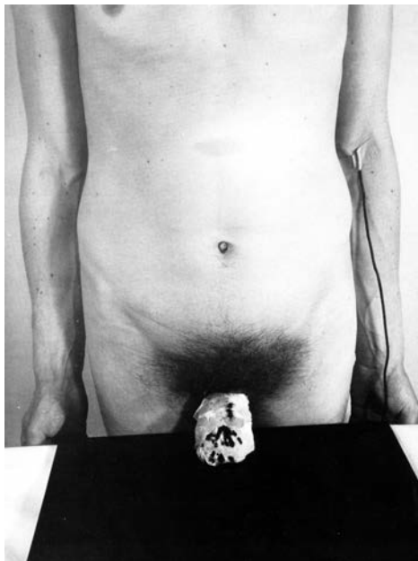
SLIKA 4: Rudolf Schwarzkogler, fotografija iz razstavnega kataloga: Documenta 5: Befragung der Realität; Bildwelten heute , Kassel, Documenta, 1972, str. 73.

renzičnih preparatov. Telo v stoječem položaju je anonimni predmet organiziranega anatomskega ogledovanja (slika 4).