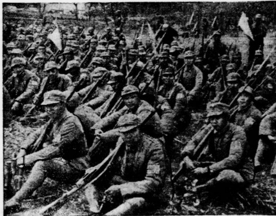
četrti armade počiva med pohodom