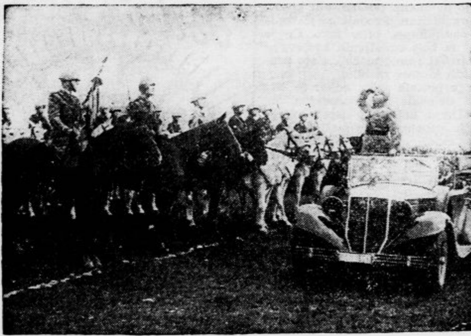
Šef Italijanske vlade je bil nedavno na inspekciji vojske v Vidmu