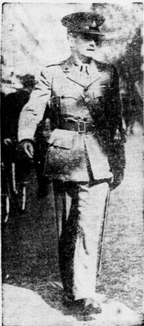
angleški vojni minister, ki inspektira obrambne postojanke Vel. Britanije ob Sredozemskem morju

domovih in internatih, po potrebi tudi v hotelih.