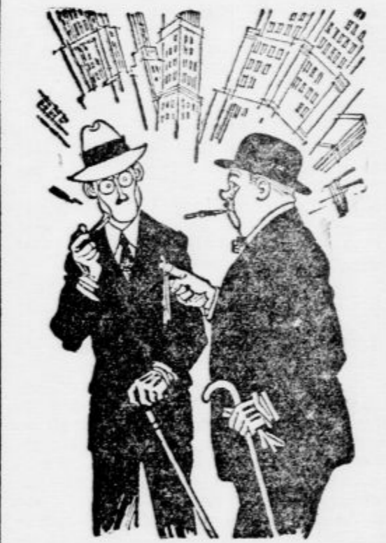
»Kakšno cumjo pa držiš ovito okrog prsta?« »Saj to ni cumja, marveč obleka moje žene, ki jo nesem v čistilnico.«