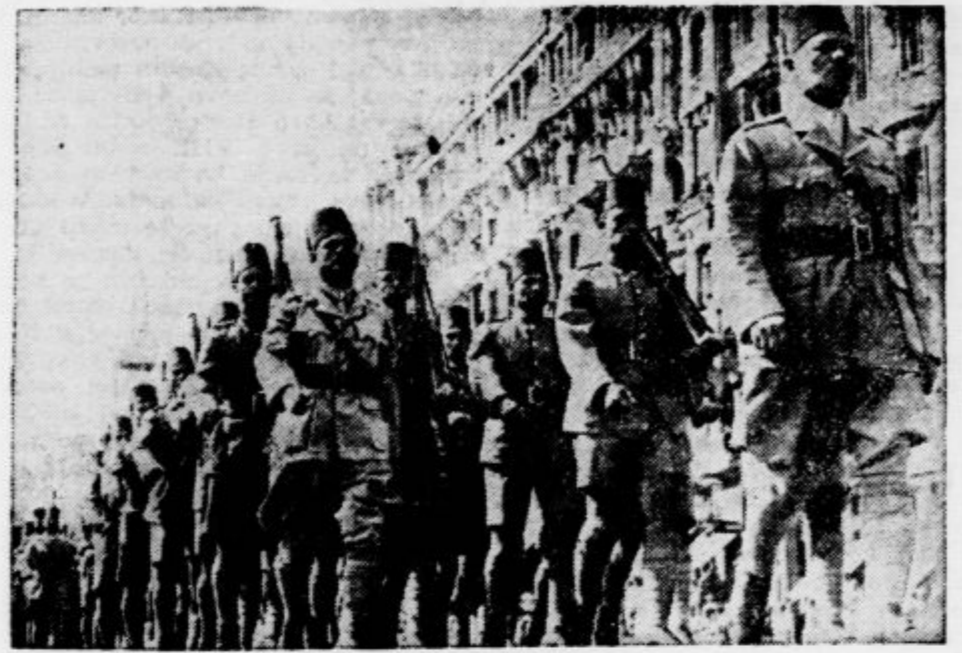
v nímohodu na ulicah Kaira