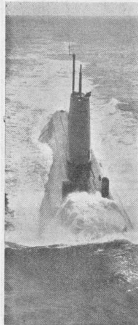
Mese dni je bila podmornica Nautilus prepuščena oceanom in samoti na svoji nenavadni poti pod ledenimi gorami Severnega tečaja.

Toda atomsko obdobje je to omogočilo. V Ameriki so izdelali prvo tako podmornico in ji dali prav tako ime, kot ga je imela čudežna Jules Vernova ladja — Nautilus. Atomska pogonska sila ne »izhlapeva« tako naglo. Celo leto more sodobni »Nautilus« voziti ne da bi menjal pogonsko »gorivo«. Odpadli so dizelovi motorji, s katerimi ne more nihče pod vodo zaradi izpušnih cevi, v ropotnico so šli akumulatorji zaradi svoje prekratke aktivne dobe. Podmornico so izpopolnili za daljše bivanje pod vodo s tem, da so izboljšali zračne naprave, uredili bivanje posadki v podmornici znosnejše, kar je bil tudi pogoj za daljše plovbe in moderni »Nautilus« je v geofizikalnem letu presenetil svet domala tako kot prvi umetni sateliti. Največji podvig je brez dvoma zadnja pot podmornice »Nautilus«. Letos poleti je krenila iz tihomorske luke Pearl Harbor proti severu. Beringov preliv v tej letni dobi ni bil pokrit z ledom in ledenimi ploščami. Od voda Aljaska je podmornica krenila naravnost proti Severnemu tečaju. Tu so se srečala s prvimi plavajočimi ledenimi ploščami. Čim