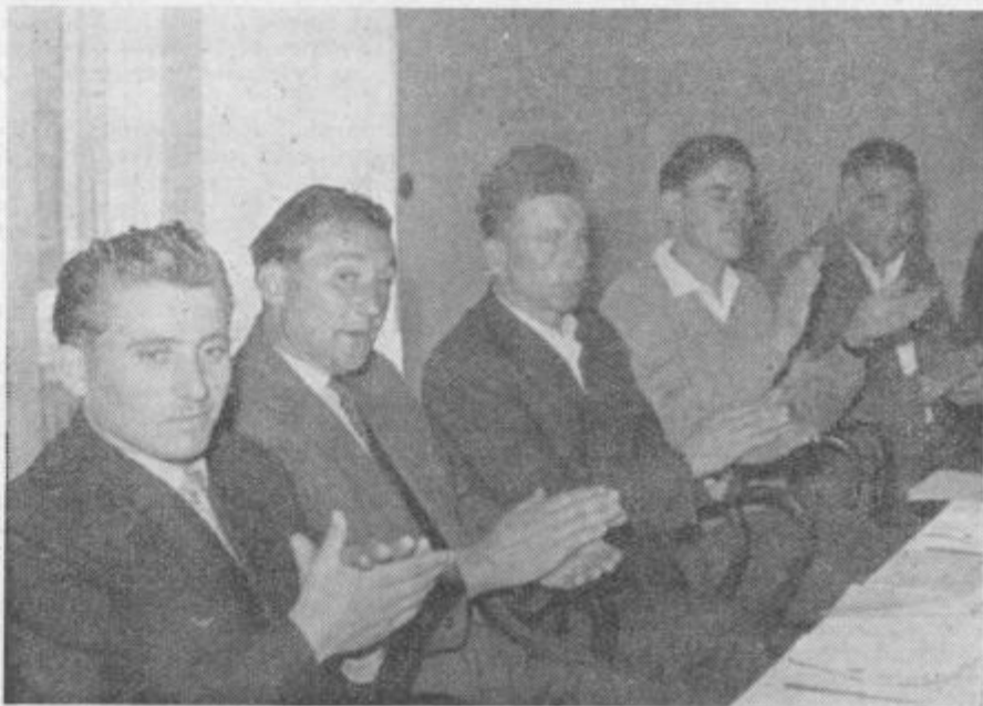
Traktoristi — asi za omizjem poslušajo prisrčne čestitke političnih, oblastnih in zadržnih voditeljev v okraju.

Izsledki sodobne živinoreje v svetu so neizpodbitni. Samo specializiran način proizvodnje in to na najvišji ravni. Danes bo vsakemu moralo postati jasno, da je čas minil, ko so živinčce spitali potem, ko je z mlekom ali vožnjo odsulžilo. Staro govedo ne bo in ne more imeti cene, ki bi za živinorejca bila interesantna. Zato bomo težili, da bodo predvsem naša kmetijska gospodarstva, poleg njih pa zadržniki v sodelovanju z zadržami, prelomila dosedanja prakso in pričela z velikopoteznim živinorejstvom. Kompleksna pitališča za vzrejo najkvalitetnejše živine za zakol in za izvoz se bodo najbolj izplačala. Klanje drobnih telet je pravcata potratnost. Samo v Sloveniji, kjer je povprečna klavna teža telet znašala okoli 64 kg, bomo z organizacijo pitališč pridelali milijarde, tržišču pa zagotovili dovolj mesa. Prepoved klanja telet je razburila duhove, toda njen cilj je jasen (Nadaljevanje na 5. strani)