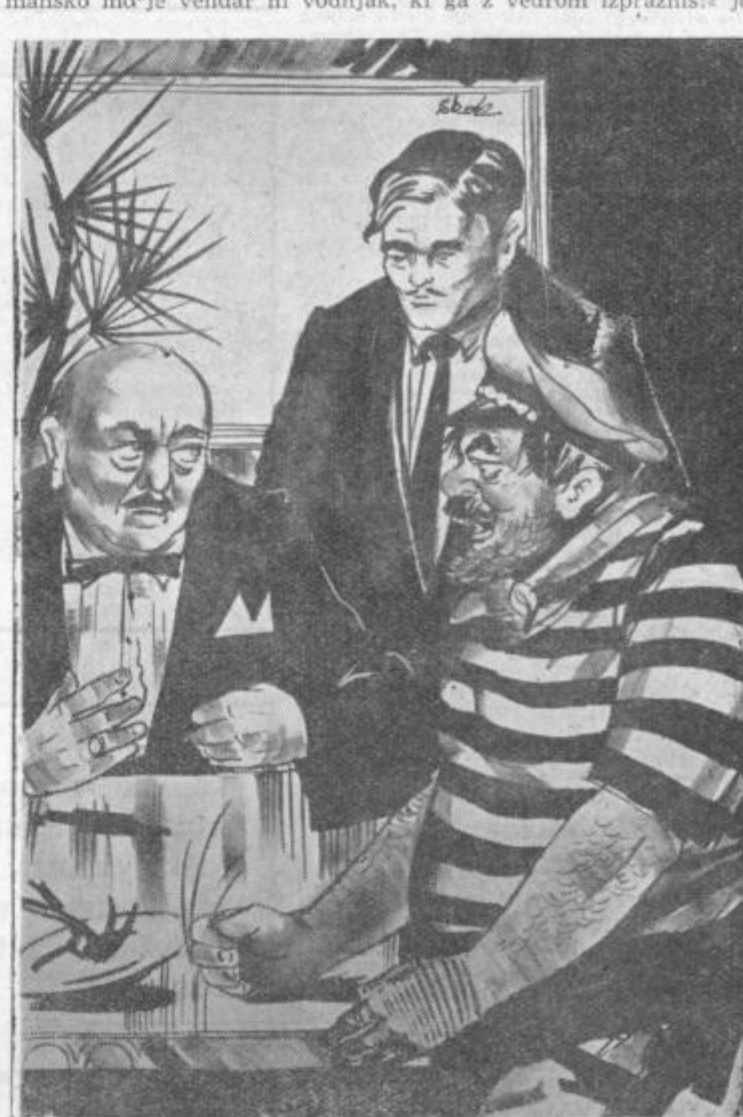
rekel guvernerju za tasmansko področje, ko ga je bil sinoči vprašal, kaj meni o tem komentarju.

»Čemu imamo klub?« se je vprašal Mr. Wright, ko je že pol ure negibno sedel in napeto razmišljal.