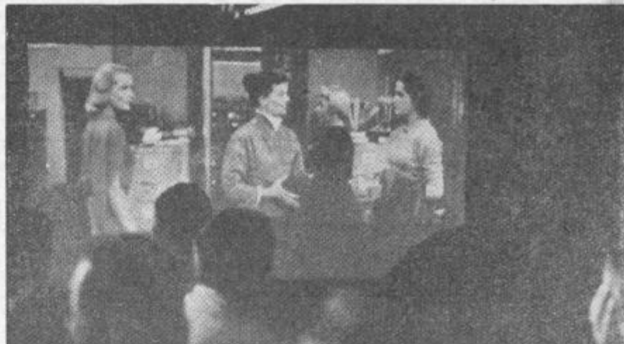
Na vožnji pod ledom Severnega tečaja so mornarji Nautilusa pogosto gledali filme. Med vsa vožnja so jih videli 34. Druge zabave pravzaprav res niso imeli v tem hladnem svetu tišine.

Njihova pot je trajala 21 dni. Dolga sicer ni bila 20.000 milj, toda 8.146 milj je tudi pot, katere doslej ni opravilo nobeno vozilo brez obnovitve zaloga goriva, še manj pa, da bi kdo pod ledeno skorjo — da uporabimo nov izraz — podplul Severni tečaj. —ček