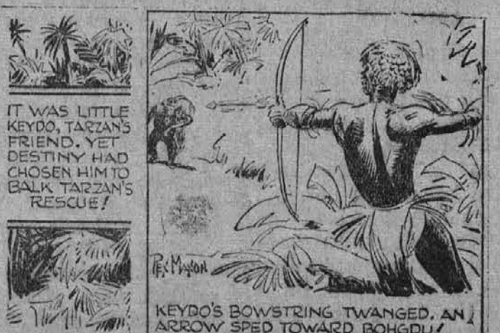
KEYDO'S BOWSTRING TWANGED, AN ARROW SPED TOWARD BOHGDU!

Po hudem boju je opica pograbila črnca, katerega bo odnesla Tarzanu v pomoč.