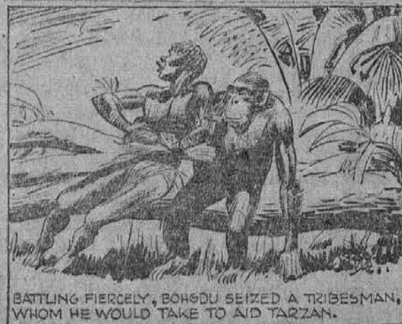
BATTLING FIERCELY, BOHGDU SEIZED A TRIBESMAN, WHOM HE WOULD TAKE TO AID TARZAN.