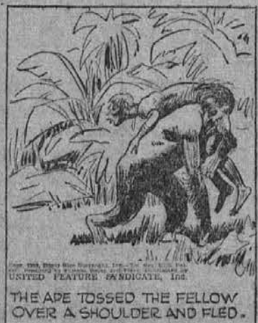
THE APE TOSSED THE FELLOW OVER A SHOULDER AND FLED.