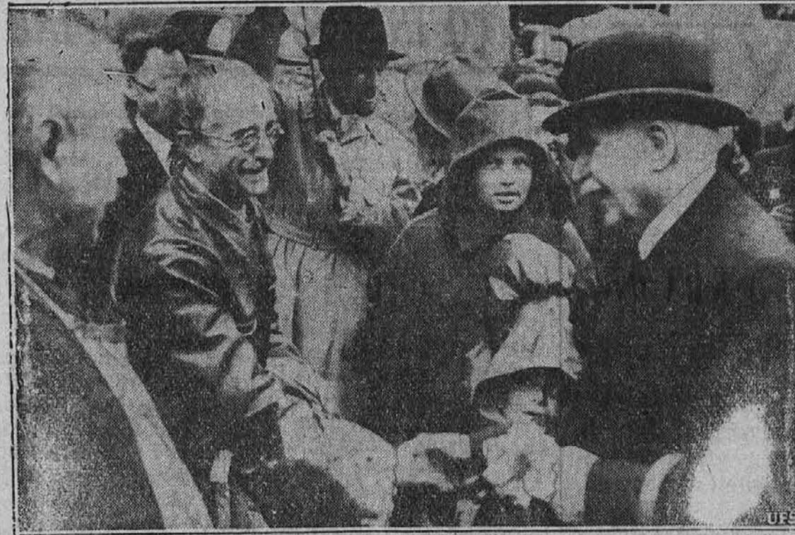
Načelnik francoske vlade, maršal Petain (na desni), je nedavno napravil potovanje po deželi, da se seznanji z ljudmi. Slika ga kaže, ko se pozdravlja s kmetijskim prebivalstvom v nekem malem kraju blizu mesta Lyon.

Prvi literarni stiki med Čehi in Slovenci