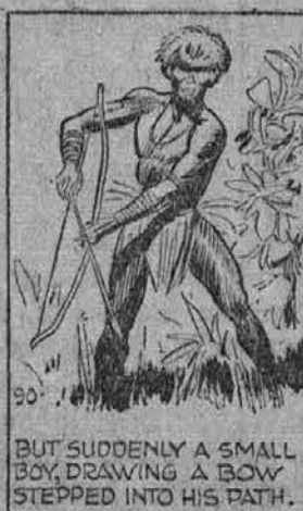
BUT SUDDENLY A SMALL BOY, DRAWING A BOW, STEPPED INTO HIS PATH.