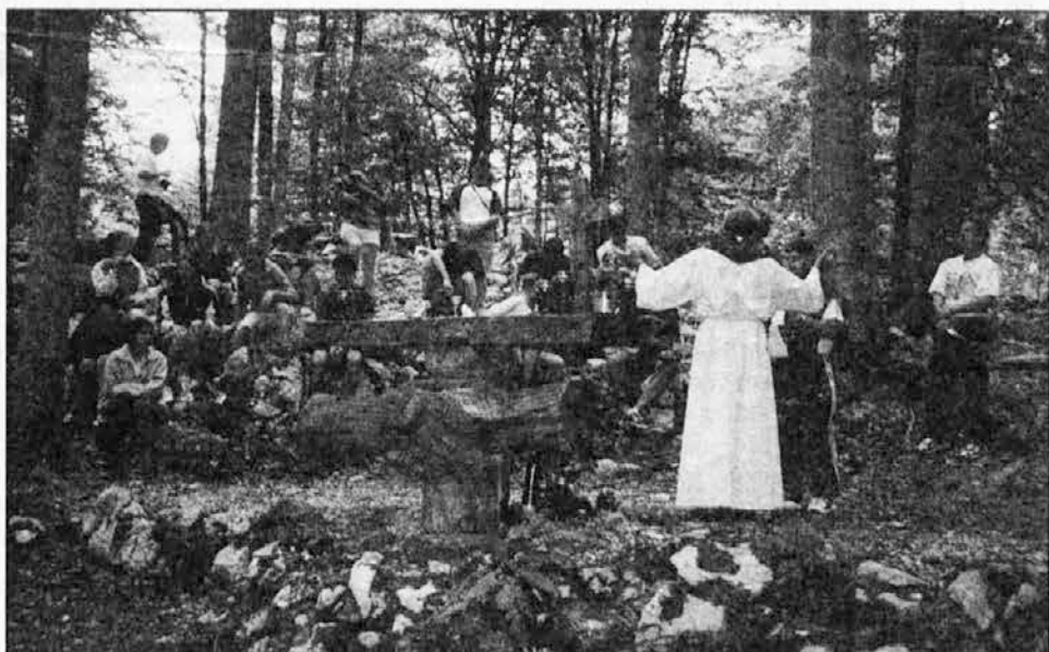
RAST pri maši v Kočevskem Rogu

Ko smo se preko Dolenjske in nato skozi Ljubljano vračali proti Adergasu, sem pomislil, da brez obiska Kočevskega Roga pravzaprav ne more biti RASTi. Če bi kdaj prišlo do tega, da Rast ne bi šla v Kočevje, bi s tem sprejeli, da se je naša skupnost odpovedala spominu in zgodovini.