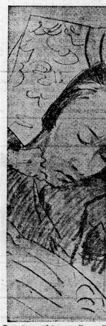
Z razstave sodobne nemške grafike v Moderni galeriji. — Erich Heckel: Speča žena

Morda je čudno, a vendar je res, da smo potrebovali skoraj