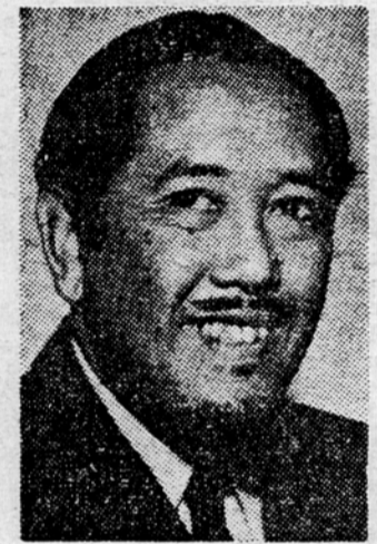
Indonezijski ministrski predsednik Ali Sastroamidjojo

Celje, 11. apr. Danes okoli pol dvanajste ure dopoldne se je z avtomobilom peljal skozi Celje predsednik republike. Prehod maršala Tita skozi Celje se je tako hitro razvedel, da so maršala in njegovo spremstvo na ulicah pozdravili mnogi domačini, zlasti pa še dijaki učiteljske ter učenci druge osnovne šole, ki so se zbrali pred šolskim poslopjem. Maršal Tito je nadaljeval pot skozi Celje proti Rogarški Slatini.