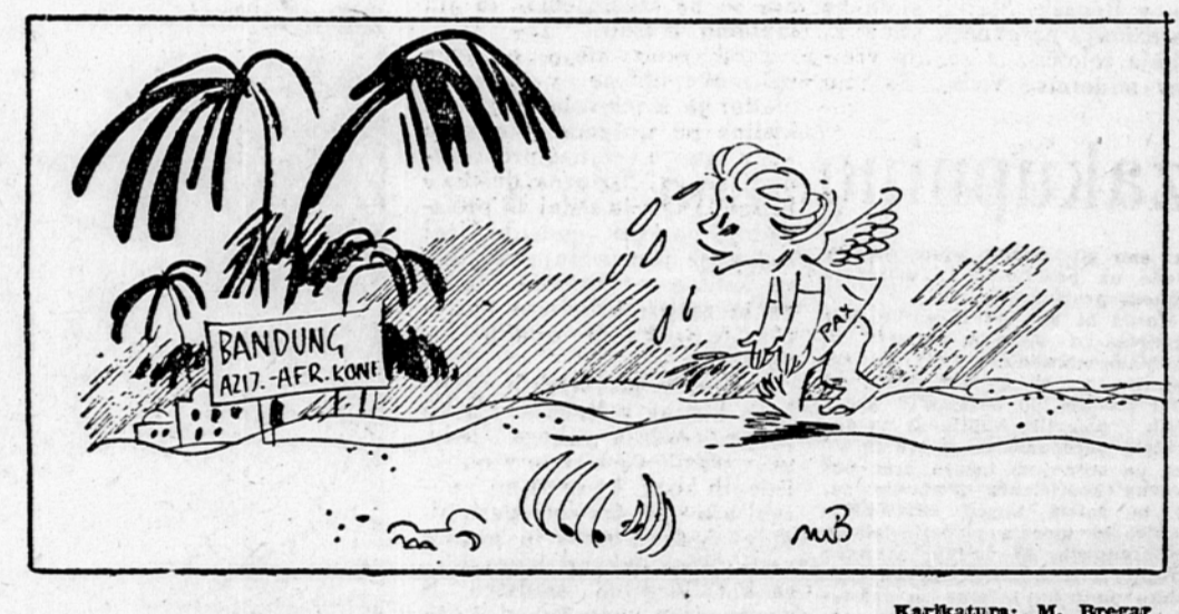
Karikatura: M. Bregar