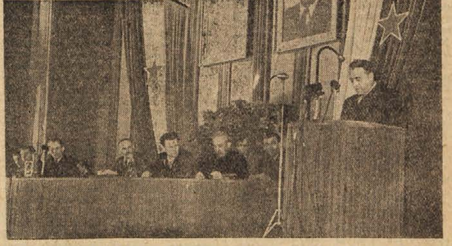
Z II. kongresa Ljudske fronte Srbije. — Predsednik LR Srbije B. Neškovič govori na kongresu

Prvi dnevi trgovanja po vezanih cenah v Prekmurju dokazujejo, da so se zadrage kljub nekaterim napakam dobro pripravile na svojo nalogo v vezani trgovini, dobro založene zadrage pa kažejo na velik uspeh delovnega napora ljudi v tovarnah in na podeželju, ki je ustvaril pogoje za zvišanje življenjske ravni delovnega človeka.