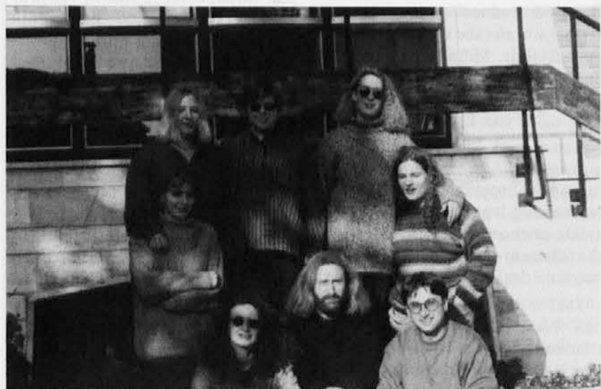
V nedeljo, 9. oktobra, so člani Mladinske lutkovne skupine Kpd Šmihel (na sliki) uprizorili v Štandreu poetično gledališko predstavo s senčnimi lutkami Drevo nad prepodom. Predstava je bila zanimiva tudi zaradi originalnega načina izvajanja.