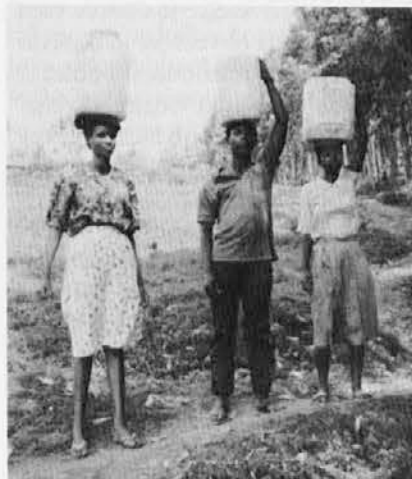
Številni so ljudje, ki potrebujejo pomoč. Tudi naša.

Izredno uspešna splošna stavka, ki se je je v Italiji 14. oktobra udeležilo na milijone ljudi, ki se ne strinjajo z Berlusconijsko vlado, ima dvojen pomen. Ekonomski značaj stavke je v tem, da so šli delavci in druge zaposleni ljudje protestirat na trge zato, ker se ne strinjajo z novim finančnim zakonom, ki bo še najbolj prizadel nižje ekonomske sloje: upokojence, delavce, uslužbence, brezposelne itd. Politični značaj stavke pa je v tem, da ljudje protestiramo proti dejstvu, da je Berlusconi privedel v vlado desnico in jo tako legitimiral, kar bo imelo negativne posledice za vse ljudi, še najbolj pa za verjetno slovensko manjšino. Italijanski škofje so podprli stavko; kardinal Ruini je med drugim dejal: »Podpiramo delavce in njihovo stavko, ker se zavedamo, da bo novi finančni zakon uperjen proti najrevnejšim državnim slojem; poleg tega pa ne moremo sprejeti nizanja pokojnin in še slabše zdravstvene oskrbe, ki jo uvaja zakon.«