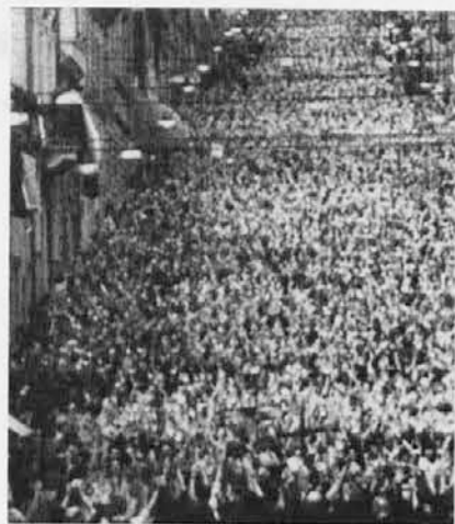
Mladi iz rimske škofije, ki so se lani zbrali v Assisiju, so začeli novo pastoralno leto. Z množičnim romanjem v Loreto. Letošnja tema je bila: Poklicani, da bi gradili nove družine. O tem so razmišljali, se pogovarjali in molili.