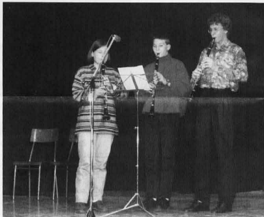
Posnetek s koncerta v štandreški dvorani