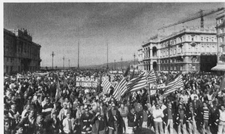
Posnetek z manifestacije na tržaškem Velikem trgu.