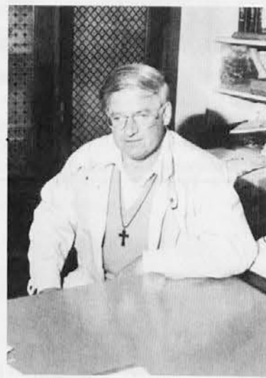
bilo več med vami.«

Rekel pa mi je, naj zapišem te njegove besede: »Iz vsega srca se zahvaljujem Katoliškemu glasu, ki mi je veliko pomagal, saj je dobro obveščal bralce o klanju v Rwandi. Še bolj pa bi se rad zahvalil vsem ljudem, ki so zame molili in prosili svetogorsko Mater božjo za vse ljudi v Rwandi. Brez teh molitev bi se gotovo ne vrnil. Iskrena hvala vsem, brez vaše molitve bi me gotovo ne bi