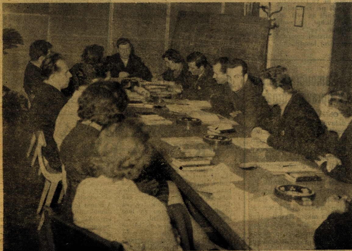
Posnetek s seje tovarniškega komiteja ZK

Sindikalna organizacija se aktivno pripravlja na skupni občni zbor, ki bo v petek 19. februarja. Do sedaj so bili vsi občni zbori sindikalnih podružnic ekonomskih enot in na njih so izvolili delegate za občni zbor celotne sindikalne organizacije. Dosedanje delo teh je uspešno izvršeno.