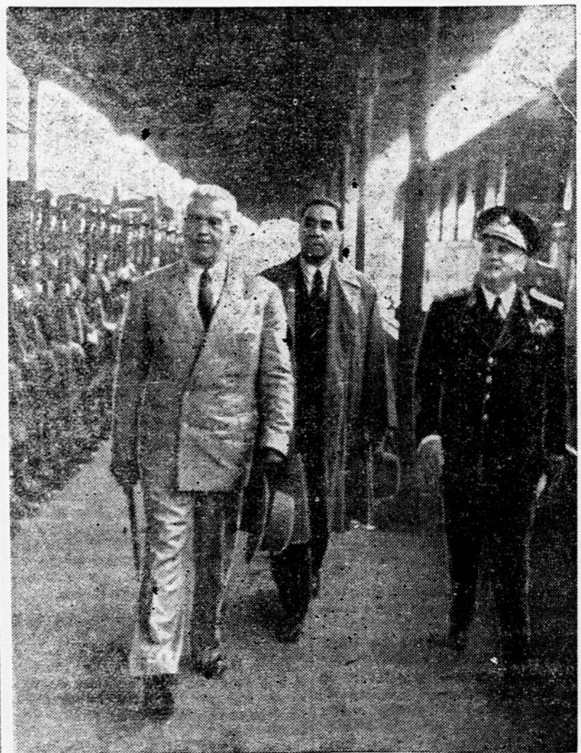
Predsednik romunske vlade dr. Petru Groza pregleduje v spremstvu maršala Tita ob prihodu na železniško postajo v Beogradu častno četo

Beograd, 7. jun. Podpredsednik ministrskega sveta in minister za zunanje zadeve Romunije Georgi Tatarescu je obiskal opoldne v spremstvu romunskega poslanika Tudorja Vianuja ministra za zunanje zadeve Stanoja Simiča ob 17. je minister Stanoje Simič vrnil obisk ministru Tatarescuju.