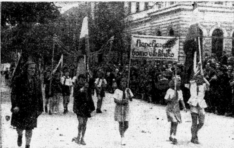
Sprevod pionirjev na Bleiweisovi cesti

Ljudska oblast skrbi za uspešen razvoj najmlajših, ki ne bodo razočarali svojih očetov, ki so jim s krvjo priborili svobodo in jim zagotovili vse pogoje za lepše življenje. Pionirji to dobro vedo in ko se bodo v letošnjih počitnicah naučili zdravja in moči v kolonijah, bodo lahko z novimi močmi nadaljevali začeto delo in zrasti v nov, močan in zdrav rod, ki ga bo spodbujala ljubezen vsega ljudstva.