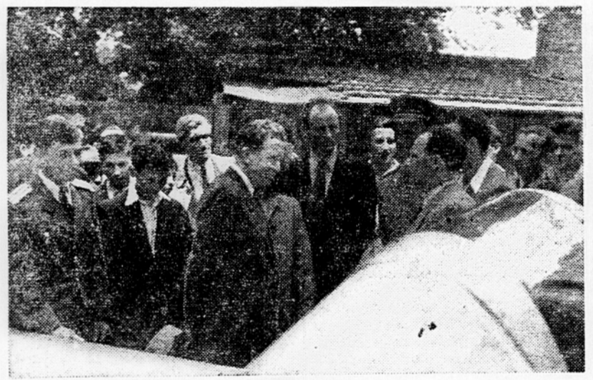
Predsednik vlade LRS Miha Marinko si je v nedeljo v spremstvu članov vlade ogledal letalsko razstavo v Narodnem domu, ki jo je za letalski teden od 8. do 15. junija organiziral republiški odbor za športno letalstvo

strijo LR Albanije. Na letališču so jih sprejeli predsednik vlade Bosne in Hercegovine Rodoljub Čolaković in predsednik Ljudske skupščine Bosne in Hercegovine Cazim Ugljen. Minister Boris Kidrič je danes prisostvoval slovesnosti, ko so izročili v obrat novo hidrocentralo v Bogatičih.