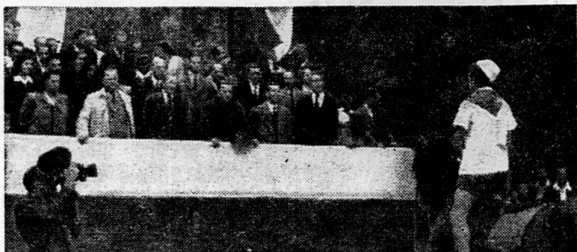
Komandant pionirjev razortira predsedniku vlade LRS Mihi Marinku

V nedeljo je bilo v Ljubljani že navsezgodaj živahno. Skupine otrok, pionirjev in pionirk, so z zarečimi očmi tekale po mestnih ulicah, ki so od njihovega veselega smeha in čebljanja drugače zazivele kot običajne dni. Kljub oblačnemu dnevu, je bilo na vsakem koraku videti, da se je pričel slovesen dan za najmlajše Ljubljančane. Ljubljanski pionirji so se pripravljali za paradu. Ob Bleiweisovi cesti je stala slovesno okrašena tribuna. V tivoljskem parku so se že zgrinjale množice pionirjev in se razvrščale v povorko. Otroško čebljanje je od časa do časa prekinila pionirska godba. Komandant parade je dajal še zadnja navodila načelnikom pionirskih odredov. Medtem se je ob cesti zvrstila množica Ljubljančanov, tribuna pa so zasedli predsednik Prezidija Ljudske skupščine LRS, člani vlade LRS s predsednikom tov. Miha Marinkom na čelu, predstavniki množičnih organizacij in drugi gostje.