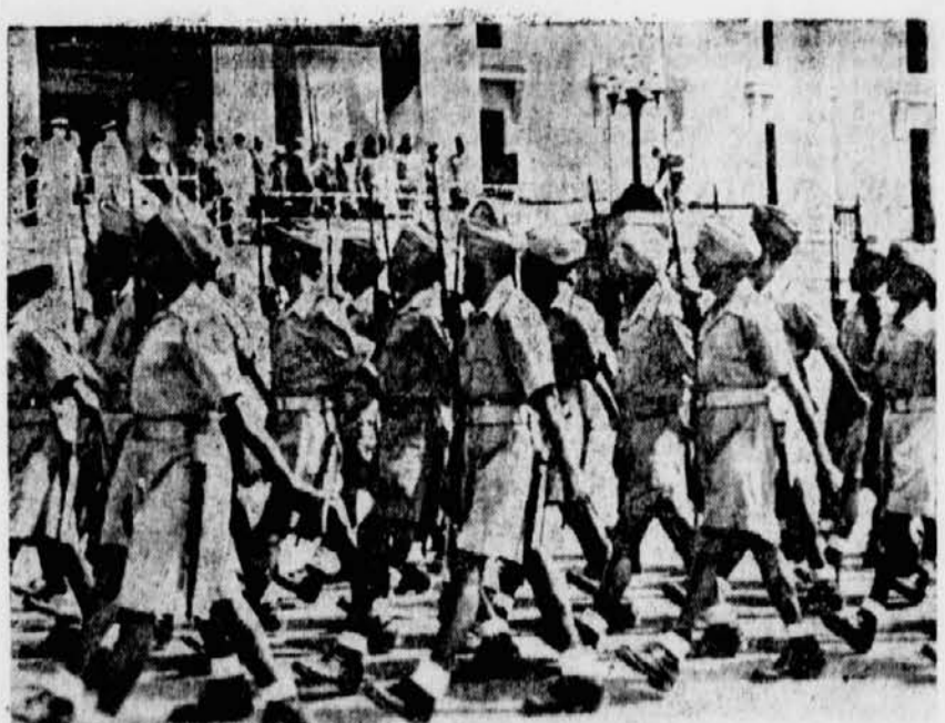
Indische Freiheitsarmee marschert. Scherl-Bilderdienst-Autoflex. Parade von Einheiten der indischen Freiheitsarmee vor dem Präsidenten der Provisorischen Indischen Nationalregierung Subhas Chandra Bose und dem japanischen Ministerpräsidenten Tojo in Shonan (Singapur).

Im Kampfraum von Gomel dauern die erbitterten Kämpfe mit den westlich und nördlich der Stadt eingeschlossenen feindlichen Kräften an. Mehrere Umfassungsversuche wurden durch eigene Gegenangriffe vereitelt und dabei Angriffspitzen der Sowjets zerschlagen oder zu-