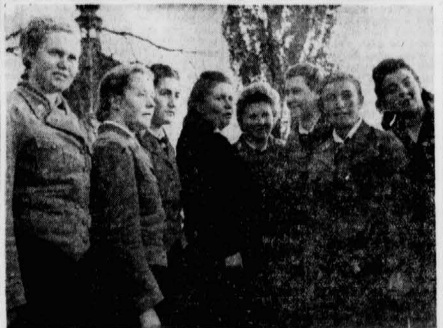
Glücklich fühlen sich die Mädels als Gäste in Rohitsch-Sauerbrunn