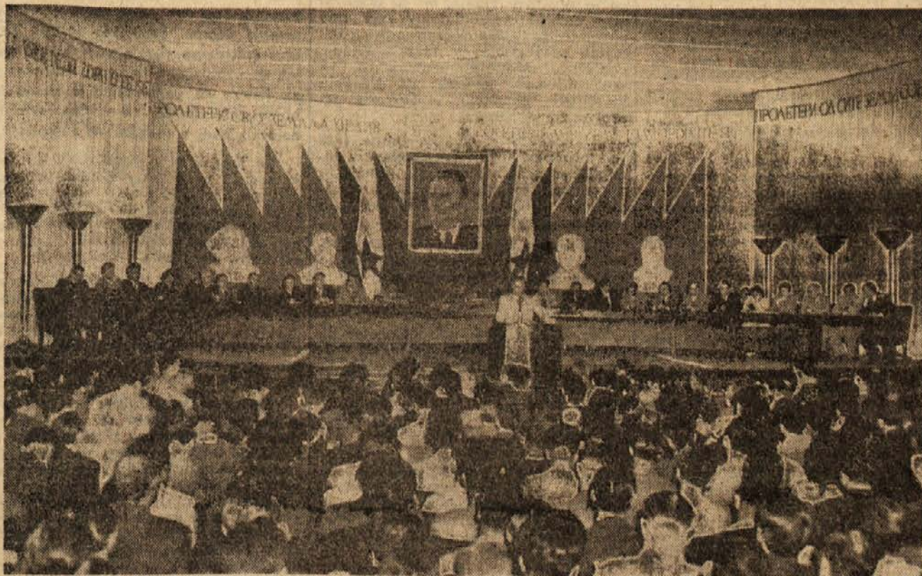
DELOVNO PREDSEDSTVO V. KONGRESA KP JUGOSLAVIJE MED GOVOROM TOVARIŠA TITA

Populariziranje Sovjetske zveze in Rdeče armade med ljudstvom in razvijanje ljubezni do nje je poleg borbe proti okupatorju glavna vsebina celotne agitacijsko-propagandne dejavnosti. Ta dejavnost je bila obsežna, vsestranska, da bi bil potreben o tem poseben referat. Partija je populariziranje ZSSR razumela kot sestavni del borbe za osvoboditev. Prepričala je množice, da je usoda narodov Jugoslavije neločljiva od usode in borbe Sovjetske zveze. Prepri-