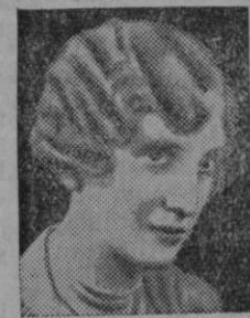
M. Podkrajšek frizer za dame in gospode, Ljubljana Sv. Petra cesta 12.

Za izboljšanje šol. razmer je sklenil obl. šol. odb. pozvati mest. obč. ljubljanska, da zgradi novo šolo v Tomanovi ulici in dozdike v Sp. Šiški in na Prulah. Zdravstvena oblast naj pregleda šolo na Vrtači in v Novem mestu, da se te šole zapro, če ne ustrezajo varnostnim in zdravstvenim zahtevam.