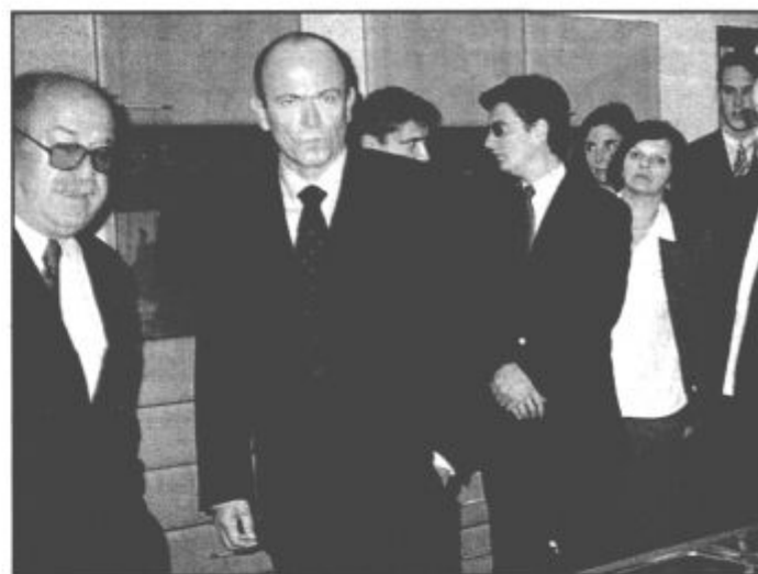
Predsednik Drnovšek si je skupaj s sodelavci in upravo Gorenja ogledal sodobno proizvodnjo štedilnikov, ki jih uspešno izvažajo, še posebej veliko zanimanja je zanje na nemškem tržišču

"Predsednika smo opozorili tudi na to, da je država zadn-