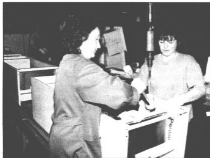
Danes proizvedejo na delavca dva in pol aparata dnevno, po sklenjeni naložbi pa bodo štiri