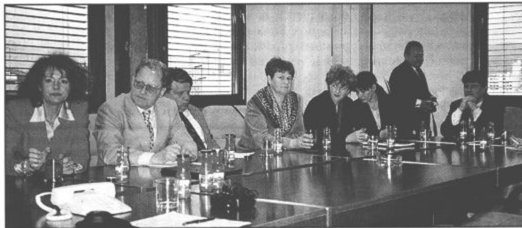
Izkušnje, ki jih izmenjujejo ekonomisti na strokovnih in družabnih srečanjih, so dobrodošle pri razreševanju vsakodnevnih težav