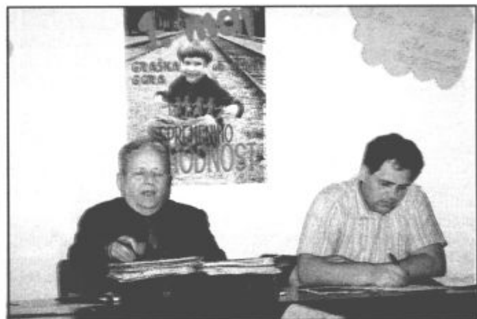
Na okrogli mizi, ki jo je o problematiki mladinskega turizma pripravilo Počitniško društvo Kažipot, so mnogi menili, da društva in organizacije, ki se v Velenju ukvarjajo s turizmom, delujejo nepovezano, eno mimo drugega.