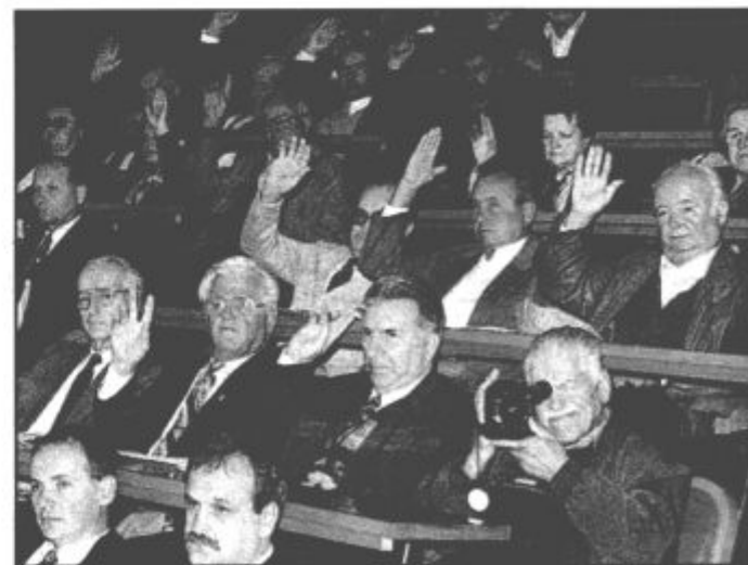
Člani borčevske organizacije vse pogosteje razmišljajo o prenovi.

Poprečna starost članov te organizacije je 76 let, bila bi še višja, so rekli, če v svoje vrste ne bi sprejeli nekaj mlajših članov, ki spoštujejo pridobitve NOB. Prav zaradi tega,