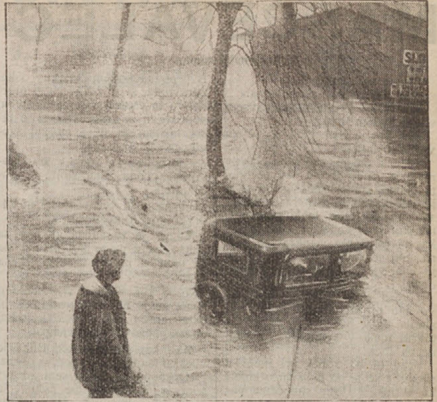
Avtomobilist, ki je moral ob nedavnih katastrofalnih poplavah v Ameriki prepustiti svoj avto valovom, da si je rešil življenje

Trenton, 26. marca. e. Hauptmann je poslal drugo prošnjo za pomiloštev. Prva prošnja za pomiloštev je bila odbita z 11:1.