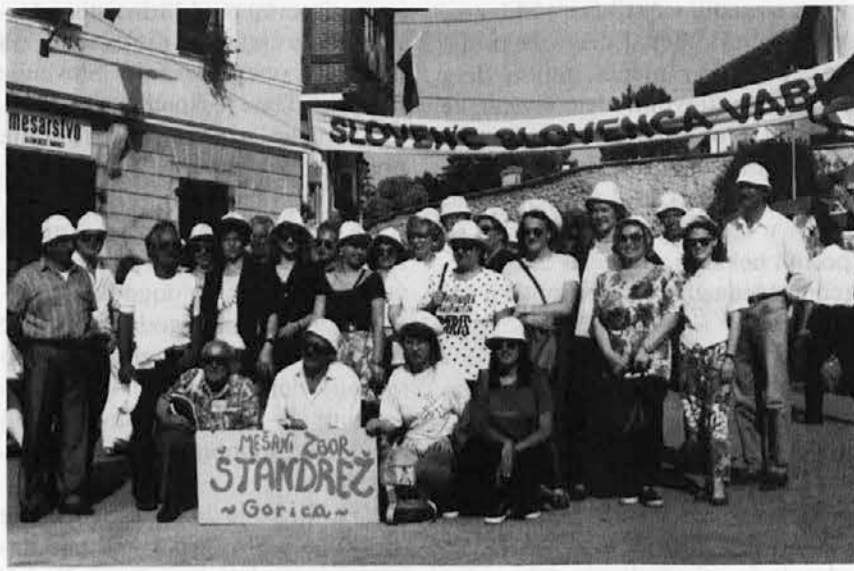
Štandreški pevci na taboru slovenske pesmi v Šentvidu v nedeljo, 20. junija

Združene moške, ženske in mešane zbor je nagovoril minister za kulturo Republike Slovenije Sergej Pelhan.