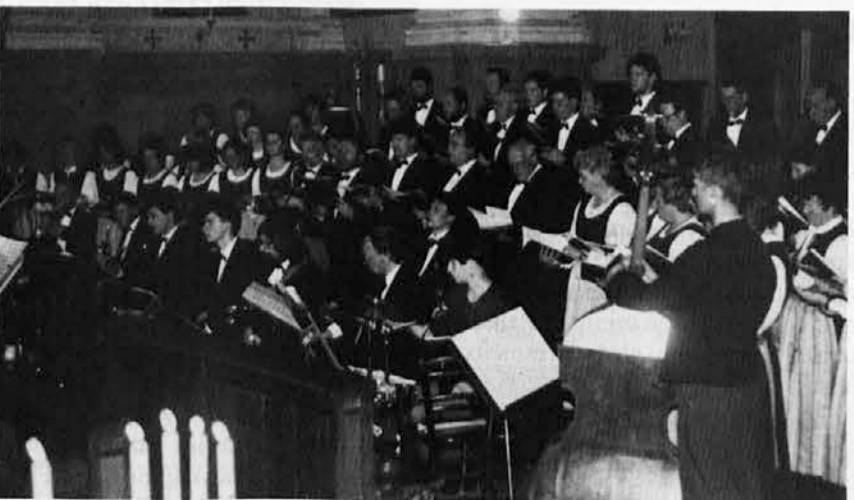
V prejšnji številki našega časopisa smo poročali o pevsko glasbenem nastopu koroških ustvarjalcev v čast škofu A.M. Slomšku. Na sliki izvajalci v štandreški cerkvi.