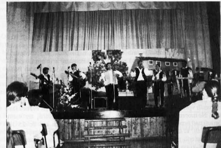
Zmagovalci 22. festivala domače glasbe v Števerjanu - Ansambel »Krt« iz Stranj pri Kamniku

Vsi trije koncertni večeri so bili polno obiskani. Čutila se je izjemna pozornost poslušalcev, aplavz je vsakič privrel iz srca. Izražal je priznanje, čestitke k uspehom, voščila za bodočnost in — zakaj ne — ljubezen in simpatijo do treh mladih, obetavnih pianistov. cb