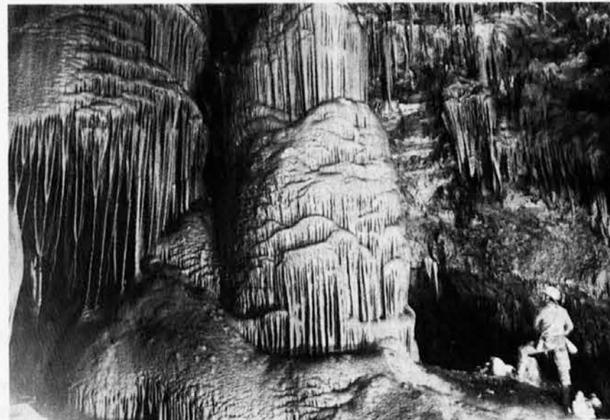
Čudoviti kapniki v novi jami blizu Bazovice