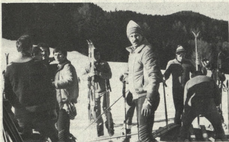
Priprave pred štartom

Objavili smo seveda spisek najboljših treh v vsaki starostni vrsti, saj bi bil spisek 77 tekmovalcev predolg. Matičnemu društvu Partizan se zahvaljujemo za tehnične usluge in podarjene kolajne.