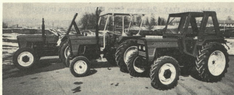
Traktorji 502 in 504 z vgrajenimi kabinami in varnostnimi loki (zadnji varnostni lok tipa Železarne Štore)