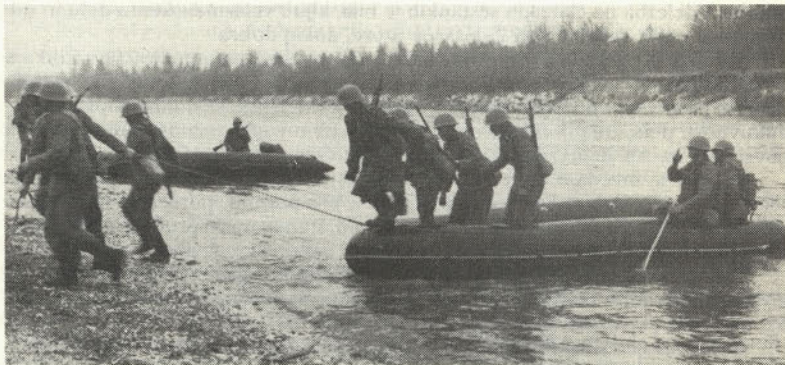
Prehod preko reke (S. Nikolič)