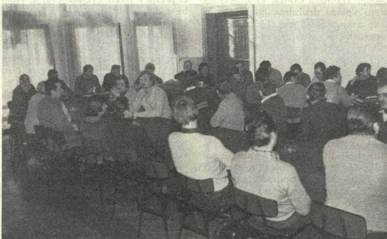
Z letnega občnega zbora OOZS TOZD Valjarna I.