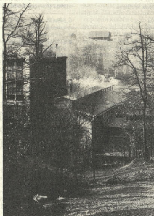
Ko skopni sneg