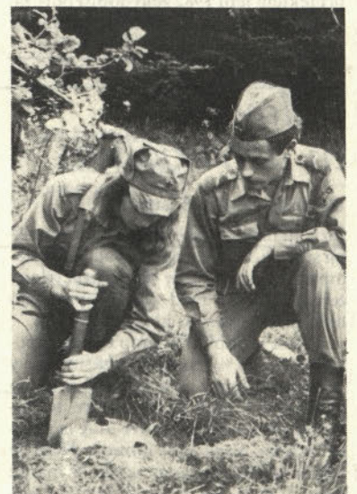
Tudi med pripadniki enot JLA – ženske (S. Nikolič)

Vsebinske in socialno-ekonomske transformacije so v naši družbi imele za posledico še popolnejše vključevanje žena v razvojne tokove naše socialistične samoupravne družbe. Samoupravljanje in samoupravni socialistični odnosi so ženam omogočili še večjo afirmacijo in vključevanje v vse družbene tokove oblikovanja svojega življenja. Izkušnje iz prakse kažejo, da imajo naše žene zelo ugoden status, ki jim ga je dalo večje udejstvovanje v skupnem