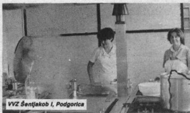
VVZ Šentjakob I, Podgorica