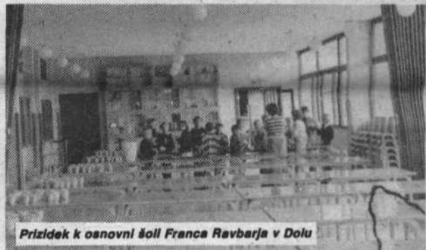
Prizidek k osnovni šoli Franca Ravbarja v Dolu