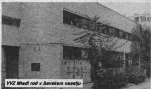
VVZ Mladi rod v Savskem naselju