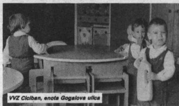
VVZ Ciciban, enota Gogalova ulica