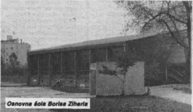
Osnovna šola Borisa Ziherta