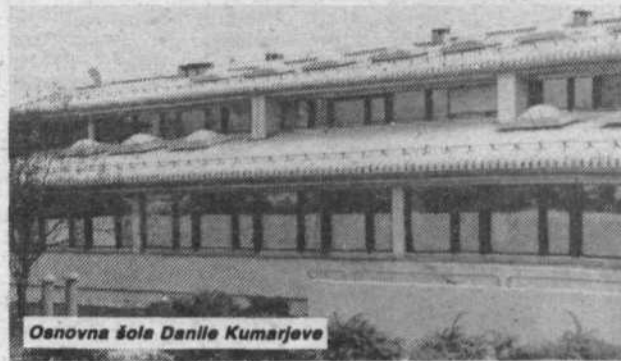
Osnovna šola Danile Kumarjeve