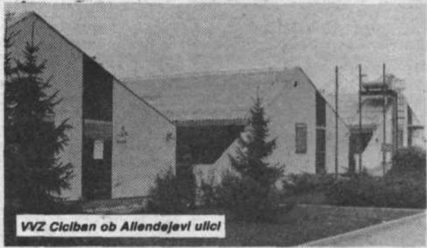
VVZ Ciciban ob Allendejevi ulici