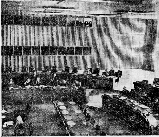
Varnostni svet OZN

Delegacija Burme je zahtevala od generalnega tajnika OZN, naj pride na dnevni red Generalne skupščine čim prej burmanska