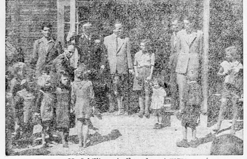
Maršal Tito v otroškem domu tovarne

Posiljajte točna poročila, kako poteka razdeljevanje semen na vašem področju. Posiljajte tudi poročila o stanju zalag semenskega blaga. Če se nimate točnega pregleda, takoj ugotovite stanje po napozah na vašem področju! Bodite v čim tesnejšem stiku s terenom in vodite točno dnevno evidenco.