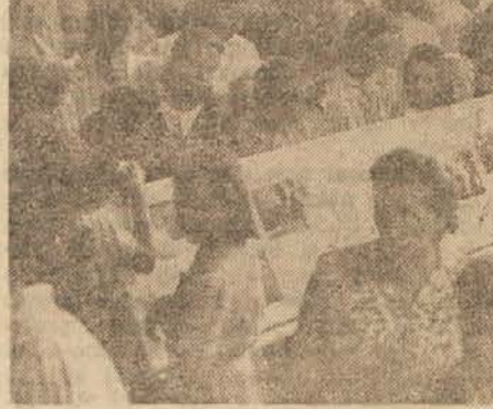
Ljudstvo na etnografski razstavi v Smarju (v ozadju so razstavljeni kmečka vrata iz Bičja)

Naši etnografi želijo le še več kadra ter večje materialne pomoči, da bi mogli v še večjem obsegu in na več mestih hkrati vršiti svoje delo. Treba je hiteti. Prav današnje tempo modernizacije in spreminjanja soci-