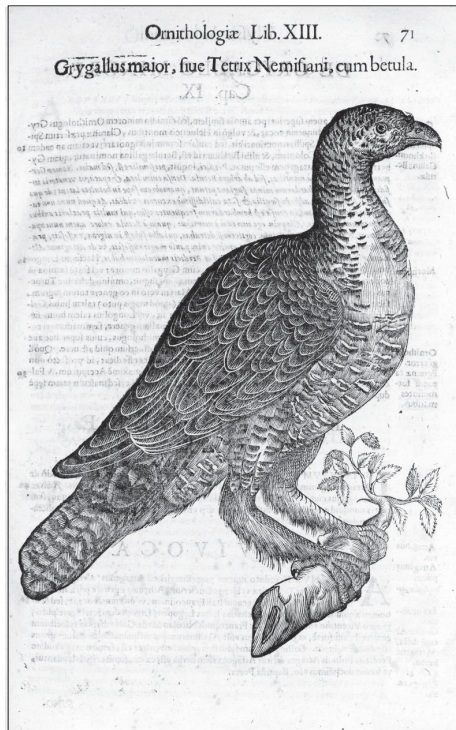
Slika 4. Samica divjega petelina (Aldrovandus, 1637). Fig. 4 Female of Capercaillie (Aldrovandus, 1637).