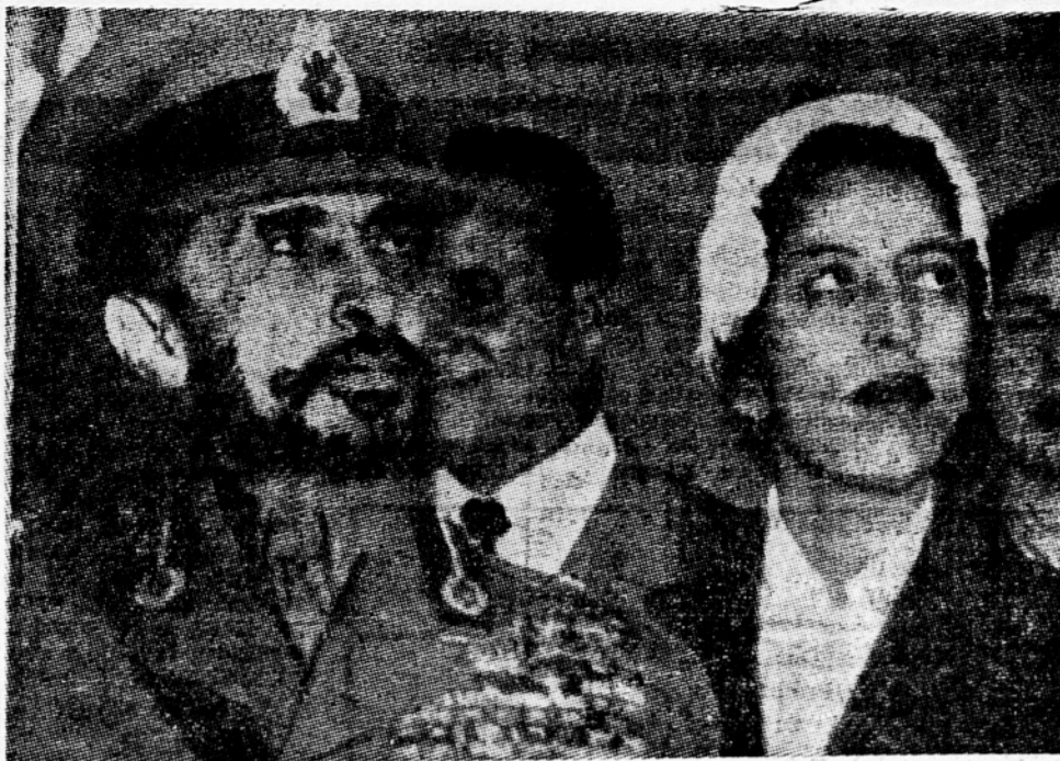
Na povabilo predsednika ZDA Eisenhowerja je etiopski cesar Halle Selassie obiskal Združene države Amerike. Po obisku v Washingtonu, kjer je govoril tudi pred kongresom in se zavezal za načela kolektivne obrambe, je etiopski cesar odšel na krožno potovanje po Ameriki. Obiskati namerava tudi Kanado in Mehiko. V jeseni pa bo, kakor je bilo včeraj javljeno, obiskal Veliko Britanijo. Na potovanju po ZDA ga spremlja nečakinja, princesa Sybil Desta, s katero ga vidimo na gornji sliki.

Po vsem tem ni nič čudnega, če se je prepad med informbejrovske »partije« madžarske delovnega ljudstva in delovnim ljudstvom doglobil v tolikšni meri, da se je v obdobju zadnjih treh let — po kongresnih statističnih podatkih — število članstva zmanjšalo, in to predvsem na podeželju, med kmečkim prebivalstvom. 12