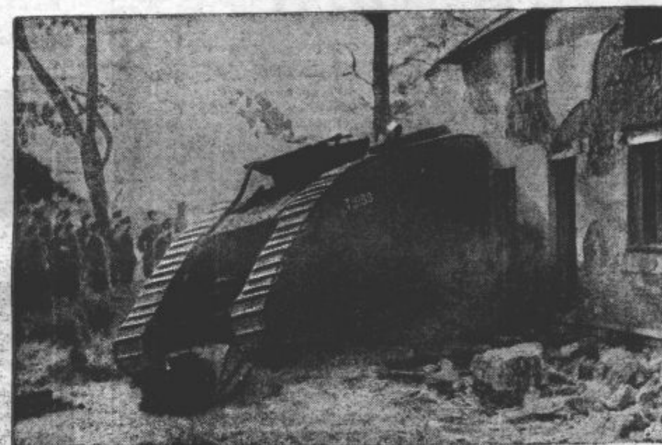
S TANKI PODIRAJO HIŠE. V Bovongdonu, grofija Dorset na Angleškem podirajo stare hiše z zastarelimi tanki iz svetovne vojne.