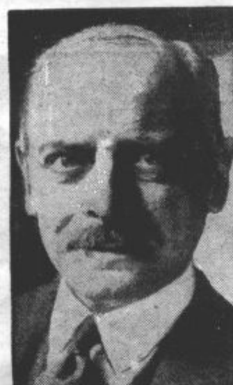
GEROF KERCHOVE DE DENTERGHEM, ki je imenovan za novega poslanika belgijske vlade v francoski prestolnici