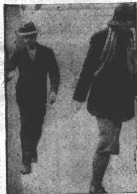
ŠADLEZNI NOVINARJI. Slavna filmska igralnica Greta Garbo (v moški obleki na levi) in dirigent Stokowski odhajata iz vaticanskega muzeja v Rimu. Zveznica je namna skušala onemogočiti posnetek za film.