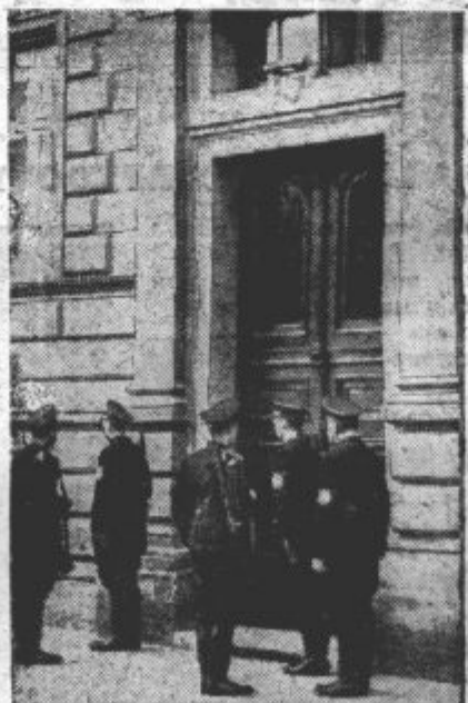
RASTRASENI MIKLAS. Zadnji predsednik samostojne Avstrije Miklas je zastrujen v Beogradu, kjer mu je narodna osvobodilna vojska dovolila stati do smrti.