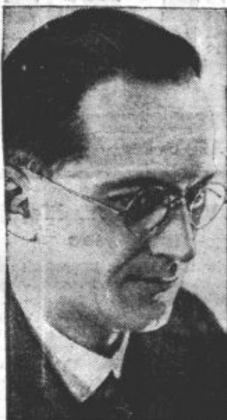
KONRAD HENLEIN, glavni propagator nemških zahtev na Češkoslovaškem