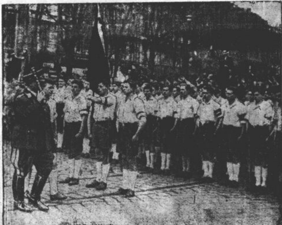
MARŠAL GÖRING NA DUNAJU. V zvezi s agitacijo za nemški plebiscit dne 10. aprila je obiskal Dunaj tudi maršal Göring. Pozdravila ga je hitlerjevska mladina.