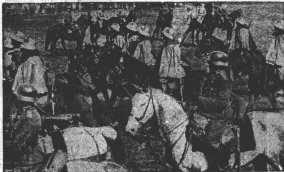
SREČANJE MED MADŽARI IN NEMCI. Pri Schattendorf na Gradiščanskem so se srečali nemški bojovniki s madžarskimi obmejnimi vojak.