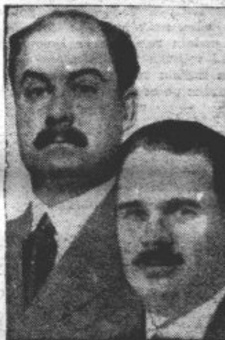
SIKOVNA FRANCA FERDINANDA SO ARETIRALI. Na Dunaju so aretirali princa Ernesta in nadvojvodo Maksima Hohenberškega, sinova v Sarajevu umorjenega prestolonaslednika Franca Ferdinanda. Eden izmed nadvojvod je nedavno javno onečastil nemški grb.