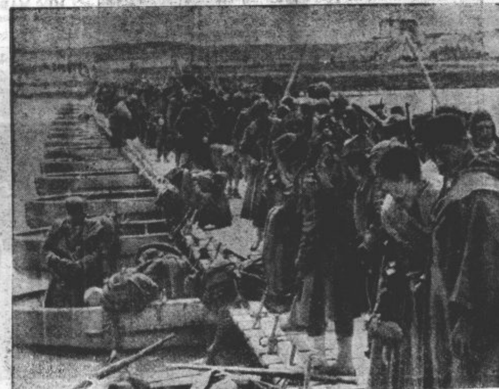
Legionarji in mavriške čete generala Franca čakajo na prevoz čez reko Ebro pri Quintu.