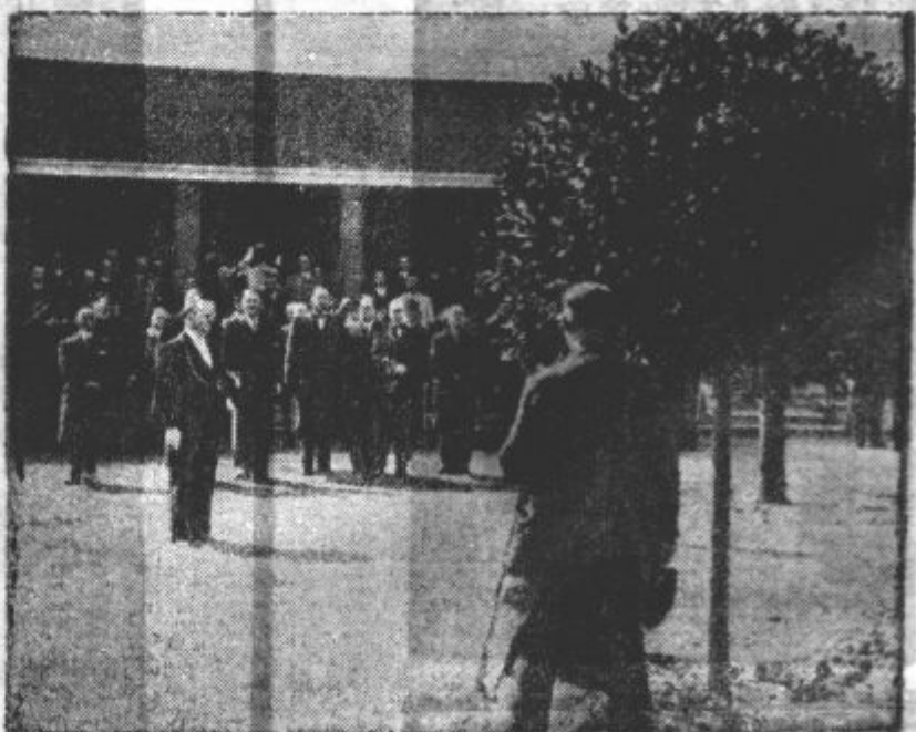
Na Coubertinovem stadionu pri St. Cloudu blizu Pariza so te dni vsadili spominsko lavoriko na čast baronu Pierreu Coubertinu, območitelja olimpijskih iger.