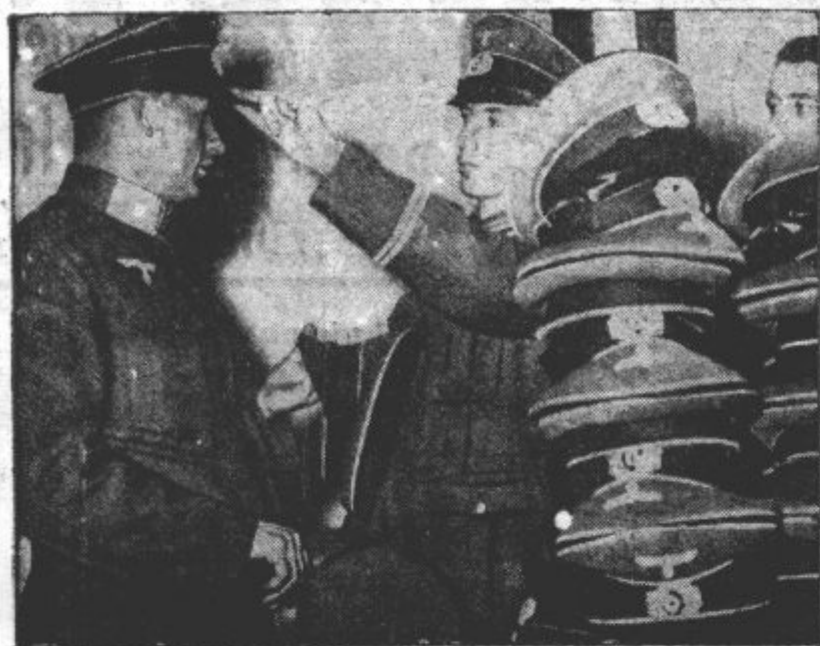
NOVA VOJASKA POKRIVALA. Avstrijski vojaški oddelki, ki so jih premestili v berlinsko garnizijo, so dobili v vojaškem skladišču najprej nove čepice.