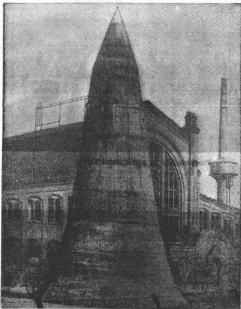
PROTIPLINSKI STOLP V BERLINU. V Berlinu so postavili železobetonski stolp, ki meri v višino 24 m in sprejme lahko 300 oseb. Stolp je od vseh strani hermetično zaprt ter prestavlja prvovrstno obrambno postojanko za primer plinskih napadov. Naprave za zračenje omogočajo ljudem, ki se zatečejo v takšen stolp, ostati v njem več ur.