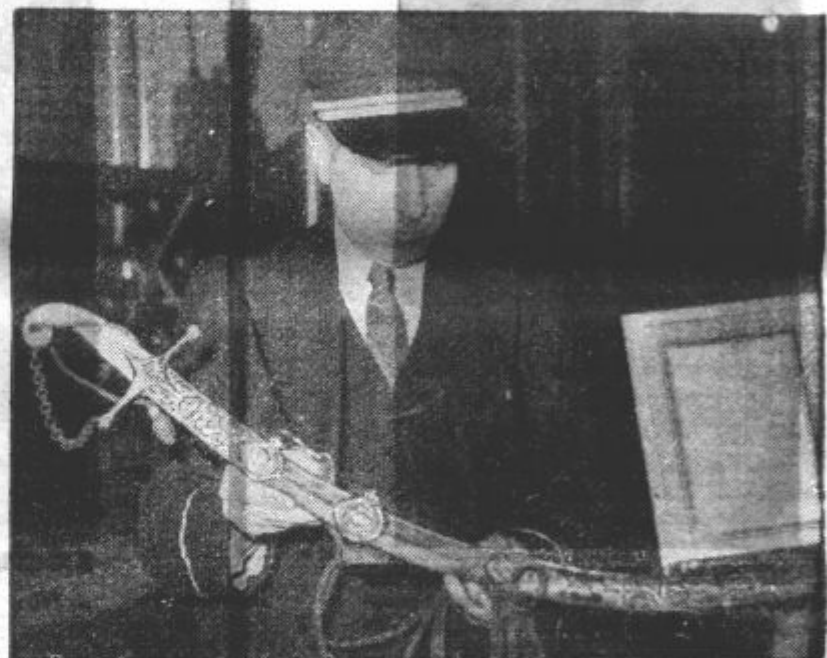
MEČ MARŠALA FOCHA, slavnega francoskega vojskovođe iz svetovne vojne, so te dni uvrstili med spomnike vojnega muzeja v Vincennesu pri Parizu.