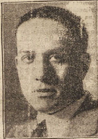
Italijanski aktivni minister na čelu letalske eskadrile v Vzhodni Afriki.

Program je objavljen, naj dejanja potrde njegovo veljavnost.