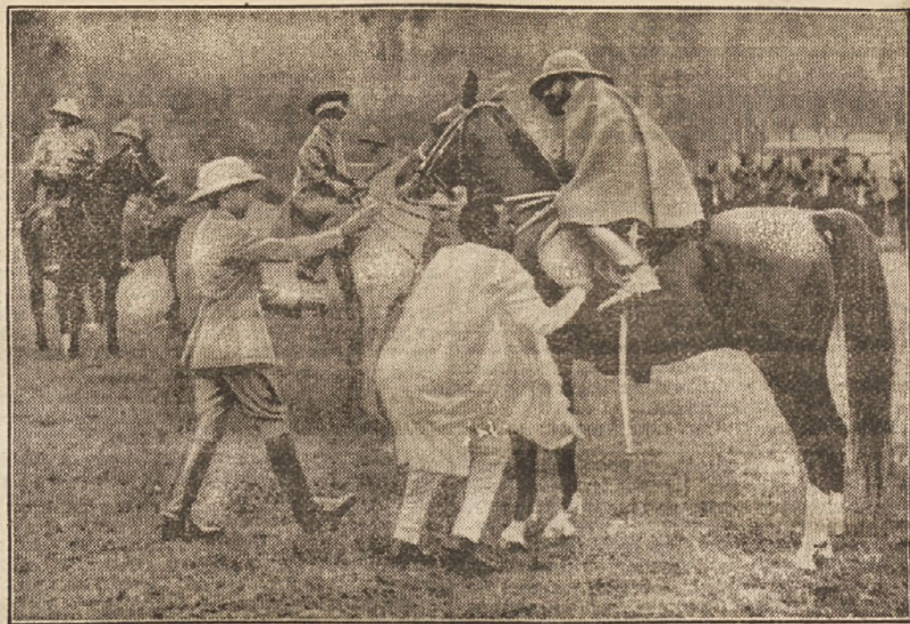
Abesinski cesar Haile Selassie pregleduje svojo telesno stražo. Pred sklicanjem etiopskega parlamenta si je abesinski cesar ogledal svojo telesno stražo. V sredini slike (v ozadju) je na konju njegov sin vojvoda od Harrare.

Kljub ogromnim čredam tudi severni jelen vedno bolj gineva. Na Grönlandiji so jih n. pr. leta 1839 ubili 37.000, in še jih ubijejo po 1000 na leto. Mnogo jih uničijo tudi polarni volkovi. Na njegovo mesto pa stopa vdomačeni jelen, ki je severnim Eskimom, Laponcem, Samojedom in Čučkom isto kar našemu kmetu kravica.