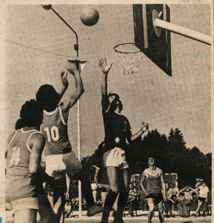
SPET KOŠ VEČ ZA KOMENDO

VRSTNI RED: 1. KAMNIK, 2. TRIGLAV, 3. KOPER, 4. RENČE, 5. RADOVLJICA, 6. NEPTUN, 7. VODOVODNI STOLP. B. G.