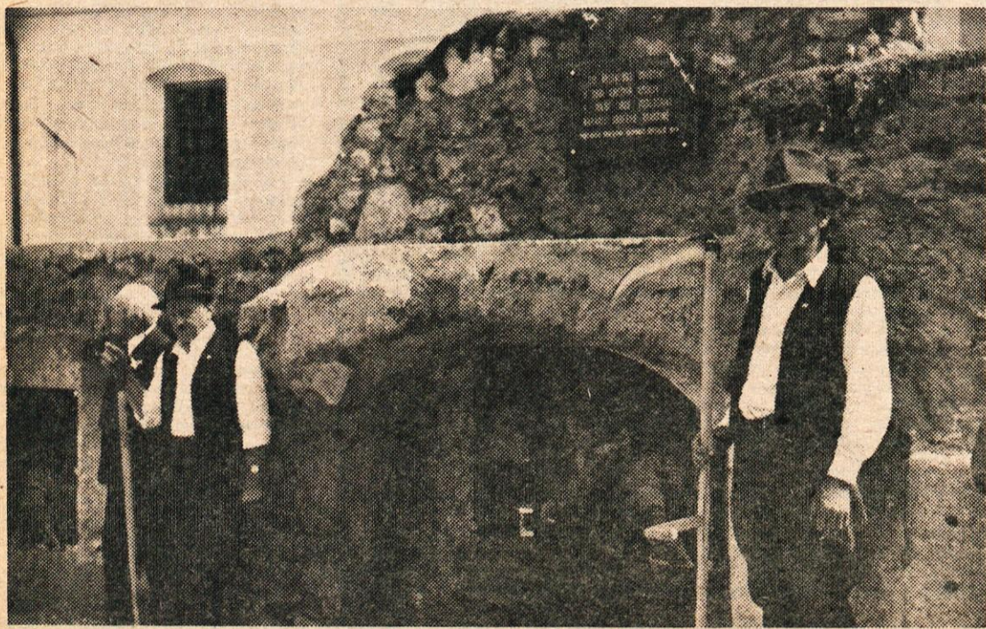
KMETJE OB SPOMINSKI PLOŠČI V ŠPITALIČU

Tovariš Zidar je podprl prizadevanja ETE po razširitvi kooperacije s kmeti in kmečkimi zadrugami, saj je ETA med redkimi, ki pri krepitvi sodelovanja s kmeti uživa velik ugled. Predlagal je tudi tesnejšo povezavo z manj razvitimi področji Slovenije, ki imajo vse pogoje za kooperacijsko proizvodnjo vrtnin. Republiški sekretar za kmetijstvo si je ogledal tudi proizvodne obrate in se o delu pohvalno izrazil. -rž