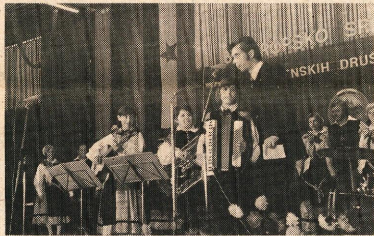
IZ JUGOSLOVANSKEGA KULTURNEGA TEDNA

športnih srečanj in kulturnih manifestacij in razstav. Gostovali so tudi naši priznani reproduktivni umetniki iz vse Jugoslavije. Prebivalcem glavnega mesta pokrajine Baden-Wuerttemberg smo s tem predstavili kulturno snovanje in dediščino naših narodov in narodnosti.