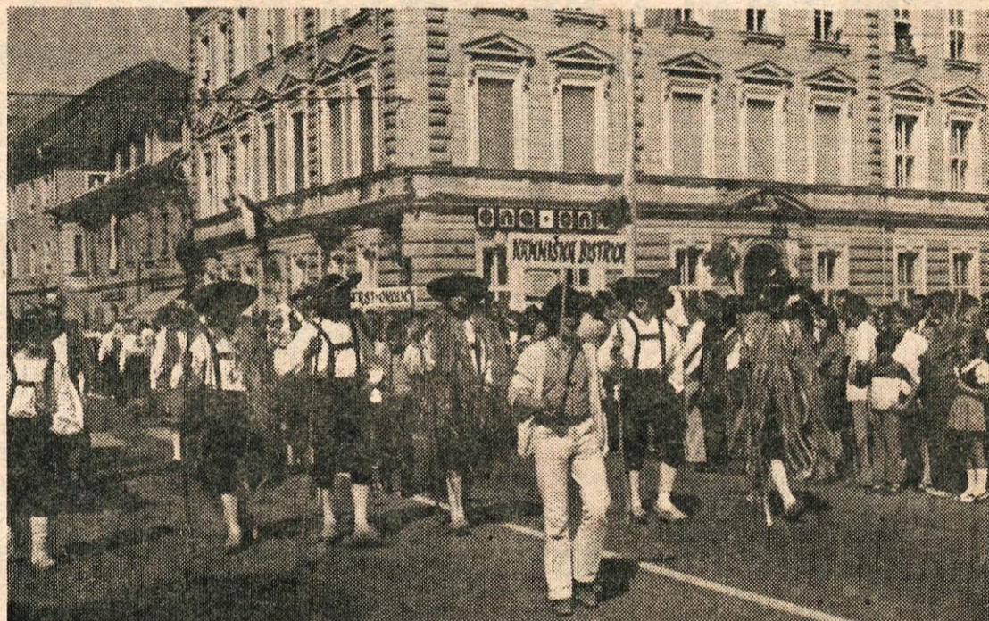
TUDI LETOS JE BILO VESELO