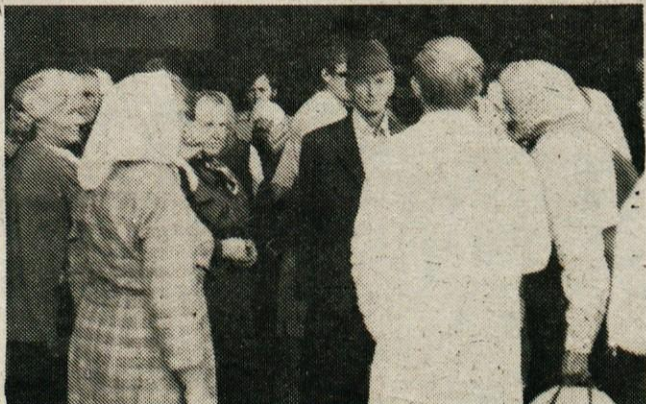
Pred nedavnim so kmetice iz Trebnjega obiskale kamniško Eto, s katero v okviru domače kmetijske zadruge sodelujejo že vrsto let kot pridne pridelovalke kumaric. Obiranje mladih kumaric je ročno in ga ne more zamenjati noben stroj. Vsakodnevno obiranje kumaric je precej zahtevno delo, saj bi vsak zamujen dan za pridelovalca pomenil veliko škodo, oziroma izpad prihodka. Nekatere kmetice so že poslušale nasvet Etinih in kmetijskih strokovnjakov ter rastline spleljale na poldrug meter visoko mrežasto oporo. Tako je prinos večji, obiranje pa znatno lažje. Na sliki: Kooperantke iz Trebnjega med obiskom v Eti, kjer so si ogledale proizvodnjo in se pogovarjale s strokovnimi sodelavci.

Za 10 odstotkov pregledanih podstrešij je bilo potrebno izdati lastnikom stanovanj ureditveno odločbo.