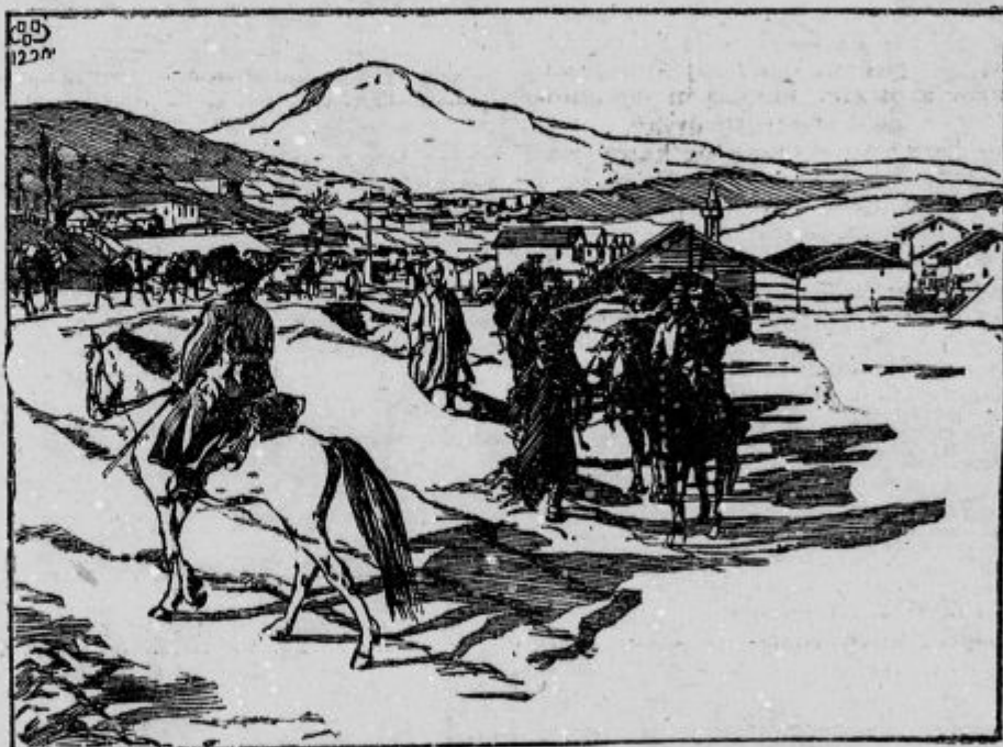
Turška tovarna kolona.

Italijanski letalski napadi. Še nikdar niso italijanski letalci s tako drznostjo ogrožali našo zemljo, kot zadnje dni pred ofenzivo. Njihovo letalsko brodoge so znatno pomnožili Francozi in Američani. — Vse