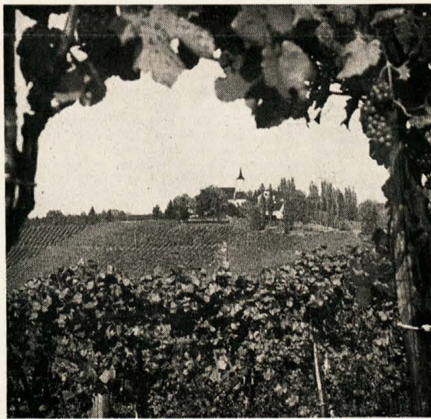
Jeruzalem v Slovenskih gorah

svojih vinogradov. JERUZALEM je naselje, ki je raztreseno po obronkih vinorodnih Slovenskih goric s prelepim razgledom na okoliške griče. Gostu bodo tu postregli s toplimi jedmi, v klasični vinski kleti mu bodo v kupico natočili čistega vinca, na širnih travnikih bo lahko uresničil željo po prijetnem pikniku. ŽELEZNE DVERI z lepo klasično