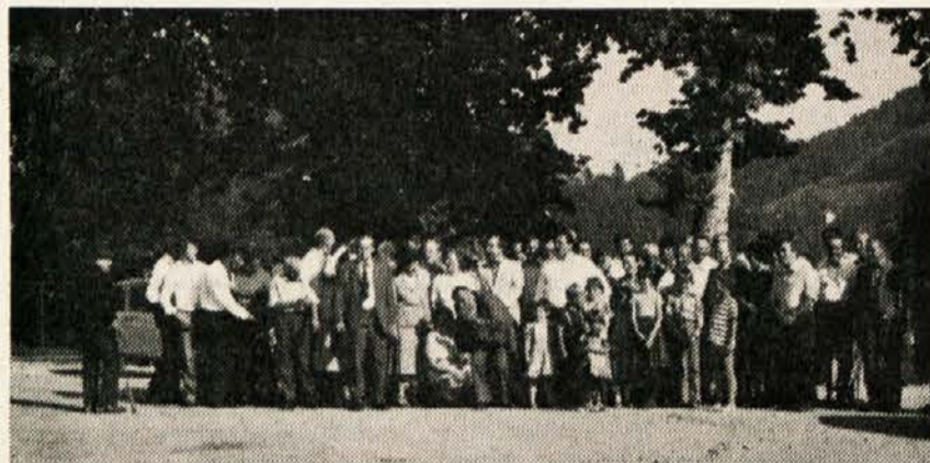
Skupinska slika obeh pobratanih društev šmihel in Zagorje ob Savi

larji tudi dobro kapljico je bil na vrsti glavni spored čebelarskega jubileja.