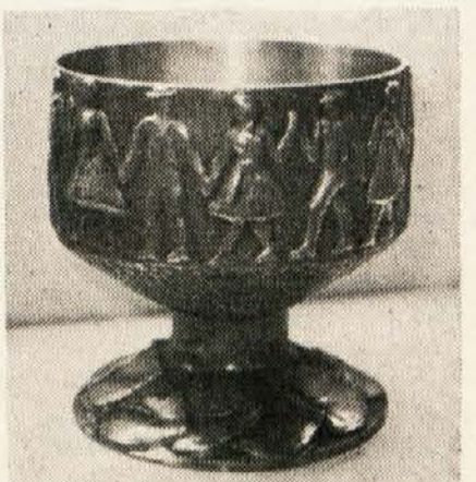
Ziljski pokal, ki ga je podarila Zveza slovenskih zadrug v Celovcu Športnemu društvu Zahomec ob njegovi petindvajsetletnici. Hkrati je razpisala enak prehodni pokal, ki ga bo dobil tisti športnik zahomškega društva, ki bo v teku petih let najbolj uspešen.