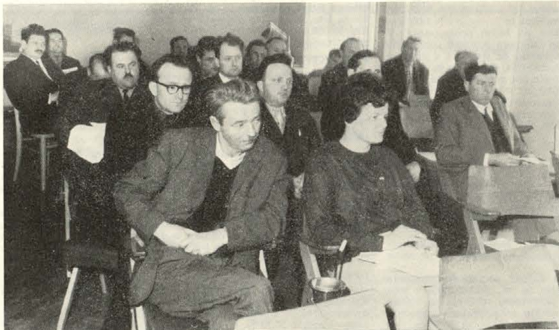
Pomembna odločitev: delavski svet podjetja sprejema gospodarski načrt za leto 1969

2. Po priporočilu upravnega odbora podjetja je delavski svet potrdil nabavo cevnih propustov tipa »Armco«. Za uvoz teh elementov se bodo koristila devizna sredstva iz amortizacije.